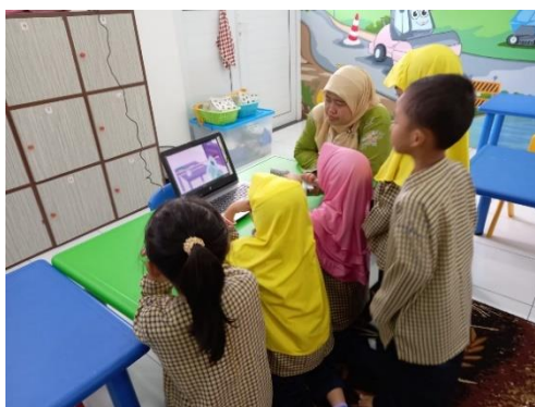
Gambar 2. Pengenalan Tanaman melalui tayangan video

Berdasarkan hasil observasi yang dilakukan oleh peneliti pada hari pelaksanaan aktivitas berkebun di TK Putra II Serang, kegiatan dimulai dengan guru menjelaskan kepada anak di dalam kelas apa itu tanaman, jenis-jenis tanaman, manfaat tanaman, serta bagaimana cara merawat tanaman melalui tayangan video pembelajaran yang sudah disiapkan oleh guru.