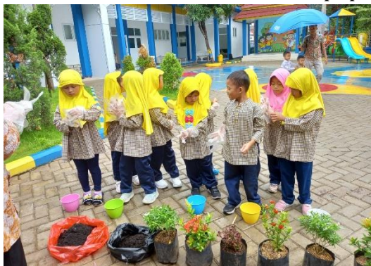
Gambar 3. Pembagian kelompok

Setelah pembagian kelompok dan pembagian tugas pada masing-masing anggota kelompok, selanjutnya guru mengarahkan anak untuk melakukan aktivitas berkebun menanam bibit tanaman hias. Selama proses pelaksanaan aktivitas berkebun berlangsung, guru semerta-merta ikut andil mengecek anak di setiap kelompok, memastikan bahwa anak mengikuti instruksi dengan benar. Guru juga memberikan bantuan bila diperlukan dan mendukung anak-anak untuk menyelesaikan tugas. Selain itu, guru memantau cara anak-anak bekerja sama di setiap kelompok. Pada tahap ini terdiri atas empat kegiatan yaitu: memindahkan bibit tanaman hias ke dalam pot, menambahkan tanah, menambahkan pupuk, serta menyiram tanaman dengan air.