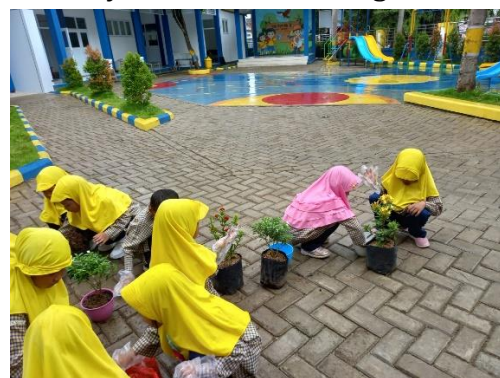
Gambar 4. Melaksanakan aktivitas berkebun

Setelah pelaksanaan aktivitas berkebun menanam tanaman hias selesai, setiap anak akan diarahkan oleh guru untuk mencuci tangan dan membantu membereskan alat dan bahan berkebun yang sudah digunakan. Selanjutnya, guru mengarahkan anak masuk kelas untuk melakukan tahap evaluasi perihal kegiatan berkebun yang sudah dilakukan. Pada tahap evaluasi ini, guru melakukan kegiatan recalling secara keseluruhan kepada anak sebagai penutup selesainya pembelajaran. Aktivitas berkebun dirancang untuk mendukung perkembangan nilai karakter kerja sama pada anak sejak usia dini. Aktivitas berkebun dapat diperkenalkan kepada anak usia dini sebagai kegiatan luar ruangan. Aktivitas ini memberikan anak kesempatan untuk terlibat dalam aktivitas fisik, melepaskan energi, dan lebih menonjolkan gerakan fisik, seperti menggali tanah, menata pot, dan menyiram tanaman [21]. Aktivitas berkebun di luar kelas