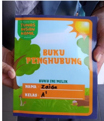
Gambar 1. Tampilan Buku Penghubung

Insan Kamil, berikut kutipannya: “Buku penghubung menjadi jembatan agar orang tua tahu mengenai kegiatan yang dilakukan oleh anak di sekolah. Buku penghubung berisi catatan kegiatan anak dan permasalahan yang terjadi pada anak sehingga guru bisa menyelidiki penyebab permasalahan tersebut. Di dalam buku penghubung juga disediakan kolom komentar orang tua sebagai tanda bahwa orang tua membaca sehingga bisa menanggapi di kolom komentar tersebut. Akan tetapi tidak sedikit juga orang tua yang tidak membaca dan mengisi kolom komentar”.