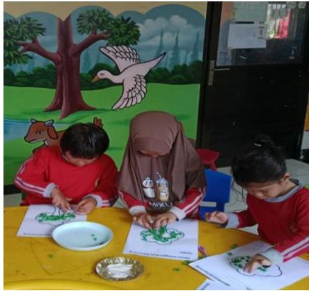
Gambar 2. Anak Mengerjakan Tugas yang Diberikan oleh Guru sebagai Bentuk Tanggung Jawab

Kerjasama guru dan orang tua sangat penting dalam proses tumbuh kembang anak. Dengan demikian guru dan orang tua perlu menjalin kerjasama yang baik. Melalui kerjasama yang baik, maka diperoleh perkembangan anak dalam menghadapi permasalahan atau hambatan belajar di sekolah. Kerjasama yang dilakukan oleh guru dan orang tua dalam menjalin kemitraan perlu dilakukan secara konsisten agar dapat mengatasi permasalahan anak.