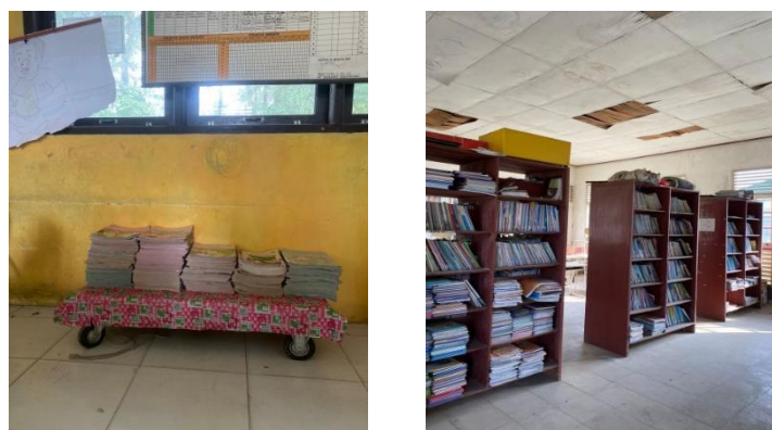
Gambar 2. Pojok Baca dan Perpustakaan

Selanjutnya Implementasi GLS terlihat dalam beberapa tahap Pengembangan yang sudah dilaksanakan yang pertama adalah kegiatan membaca terpadu. Membaca terpadu merupakan tahap pengembangan dalam gerakan literasi sekolah di SDN 007 Teratak Air Hitam. Berdasarkan hasil wawancara dengan Wali kelas III. Membaca terpadu yang di laksanakan di SDN 007 Teratak Air Hitam tahapan yang di laksanakan adalah sebagai berikut Guru memandu peserta didik dalam kelompok kecil (4-5 anak) dalam kegiatan membaca, tujuannya untuk meningkatkan pemahaman mereka. Fasilitas pendukungnya yaitu buku untuk di baca. Di dalam kegiatan ini guru menetapkan tujuan membaca terpadu, misalnya siswa membaca buku yang berupa buku fiksi dan non fiksi. Kemudian Ibu wali kelas meminta siswa untuk mencari kembali sebuah isi bacaan dengan kata kata sendiri lalu di tulis.