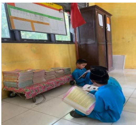
Gambar 4. Siswa membaca buku di pojok baca

Selain itu, ketika proses pembelajaran berlangsung terdapat beberapa siswa yang sibuk bermain, ada juga siswa yang mengganggu temannya, ada siswa yang keluar masuk kelas dan lain sebagainya. Hal tersebut juga didukung oleh 4 orang siswa kelas III dan wali kelas III SDN 007 Teratak Air Hitam. Kemudian berdasarkan hasil wawancara dan observasi dengan kepala sekolah siswa kurang antusias dalam membaca dan mencari sendiri jawaban dari soal soal yang telah di berikan oleh guru, siswa lebih banyak bertanya tentang jawaban yang sudah tersedia di dalam bacaan. Siswa juga akan mulai membaca apabila di perintahkan oleh guru. Membaca lebih dari sekedar mengalihkan pandangan dari margin kiri ke kanan; Sebaliknya, ini melibatkan pemikiran untuk memahami apa yang telah Anda tulis [22]. pendapat Arsyah dkk., yang mengungkapkan bahwasanya literasi anak sangat penting diperhatikan karena dengan kemampuan literasi yang baik, anak akan mendapatkan keterampilan yang baik pula [23].