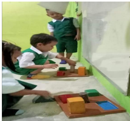
Gambar 2. Anak bermain Balok

Anak ditanamkan untuk memiliki karakter kejujuran, dengan tidak mengakui benda yang bukan hak miliknya. Pendidikan kejujuran dimulai dengan mengajarkan anak dari hal-hal sederhana hingga kegiatan yang lebih rumit. Hal ini dapat dilihat pada gambar 2.