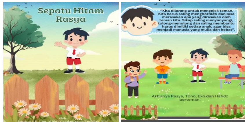
Gambar 6. Cerita tema empati