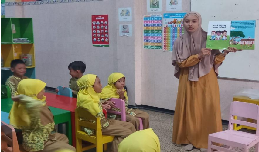
Gambar 12. Guru melakukan read aloud and singing tema kasih sayang

Temuan penelitian saat ini menerapkan strategi read aloud and singing selaras dengan temuan penelitian sebelumnya yang mengungkapkan bahwa singing atau bernyanyi merupakan sarana yang tepat dalam pembentukan pendidikan karakter anak dengan menyanyikan lagu “damai Indonesiaku” [20]. Sedangkan pada Read aloud untuk melatih kemampuan literasi anak usia dini seperti menyimak, berbicara, atau menulis. Dengan menggunakan metode read aloud dapat meningkatkan literasi pada anak [21]. Indikator pada read aloud and singing berdampak pada kemampuan literasi anak untuk pra-membaca, memegang alat tulis, menulis, menyalin kata, mendengarkan cerita, menebali angka dan huruf, mengenal dan mengingat huruf abjad serta pemahaman akan nilai-nilai karakter positif dalam diri anak [22].