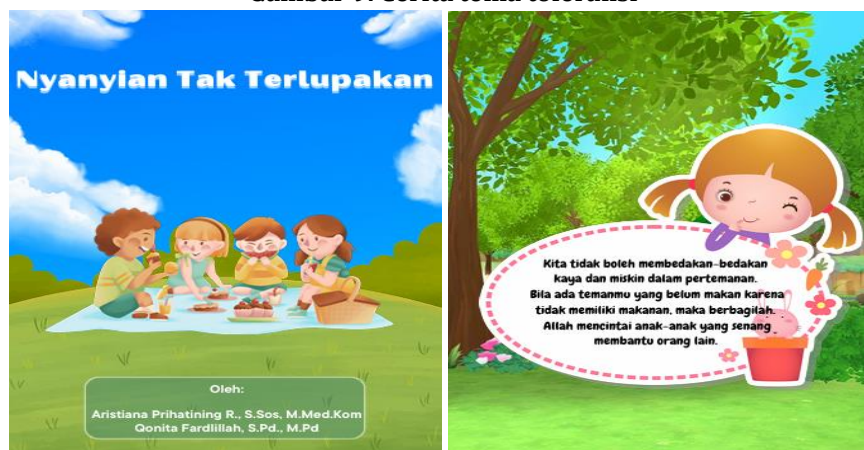
Gambar 10. Cerita tema saling berbagi

Beberapa tema buku cerita tersebut diuraikan menjadi suatu cerita oleh penulis berdasarkan fenomena yang sering terjadi pada aktivitas keseharian siswa di kelas. Fenomena tersebut mengangkat kisah-kisah anak yang dibully oleh temannya baik secara sengaja atau tidak sengaja. Isi cerita dikuatkan dengan contoh kasus nyata bullying pada anak TK. Hal ini selaras dengan temuan penelitian Nasution menunjukkan bahwa banyaknya kasus bullying yang terjadi pada anak di kelas disebabkan karena hal sepele misalnya bermula dari anak menangis karena diejek temannya, tidak diajak bermain, mengganggu teman, memaksa dan mengancam teman dan akhirnya mengadu pada guru kelas [16]. Cerita tersebut kemudian diimplementasikan pada penerapan Read Aloud