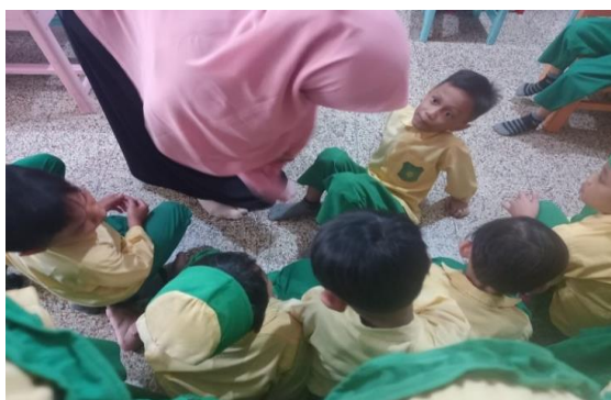
Gambar 2. Guru menasehati anak yang melakukan tindakan bullying fisik

Korban bullying adalah anak yang dianggap lemah di kelas. Mereka yang termasuk didalamnya adalah anak yang kurang bisa bersosialisasi dengan temannya, anak yang memiliki rasa percaya diri rendah, dan mereka yang memiliki kemampuan belajar agak tertinggal dibandingkan dengan teman-temannya. Sehingga upaya yang dilakukan guru adalah menasehati anak-anak untuk tidak melakukan perbuatan bullying fisik.