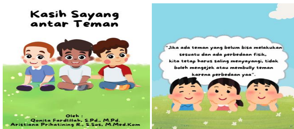
Gambar 8. Cerita tema kasih sayang