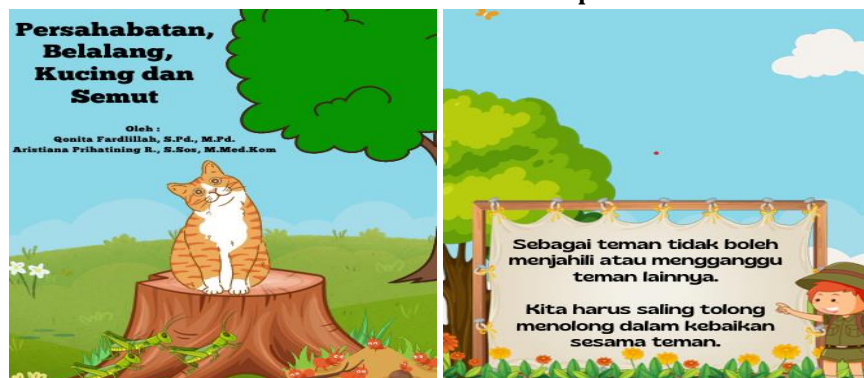
Gambar 7. Cerita tema tolong menolong