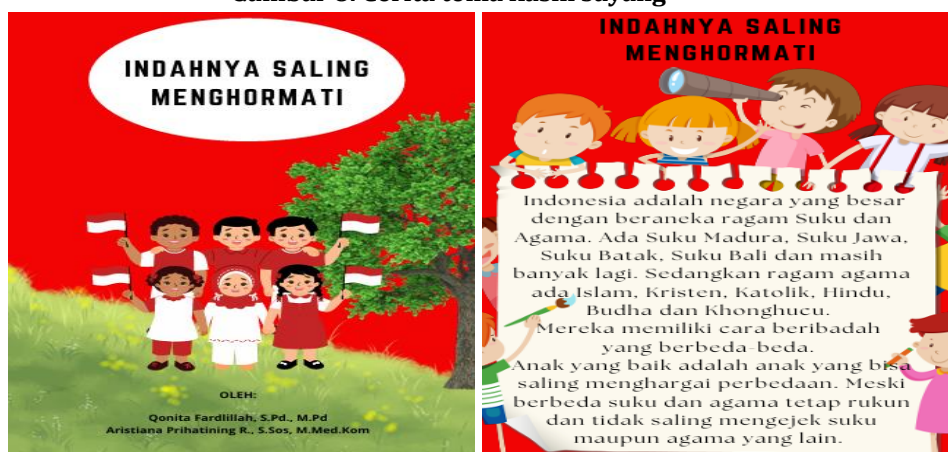
Gambar 9. Cerita tema toleransi