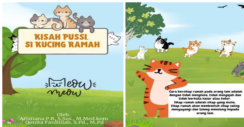
Gambar 5. Cerita tema sikap ramah

Penerapan read aloud and singing dilakukan guru sebagai upaya edukasi dan pencegahan bullying fisik dan verbal. Adapun read aloud dilakukan dengan menggunakan media buku cerita yang memiliki 5 tema cerita dengan isi cerita yang berbeda dan mengandung nilai-nilai karakter anti bullying pada anak. Nilai-nilai karakter yang ada dalam buku cerita yaitu tolong menolong, empati, kasih sayang, sikap ramah, toleransi dan berbagi. Terwujudnya nilai-nilai karakter dapat mendorong sikap positif terhadap lingkungan alam dan menciptakan kondisi ideal di masyarakat sehingga penguatan karakter harus diajarkan sejak dini [19]. Peran yang ada dalam buku cerita berupa manusia dan hewan yang memberikan pesan cerita agar anak-anak tidak melakukan bullying dengan temannya dan membiasakan penerapan nilai karakter positif yang ada dalam cerita.