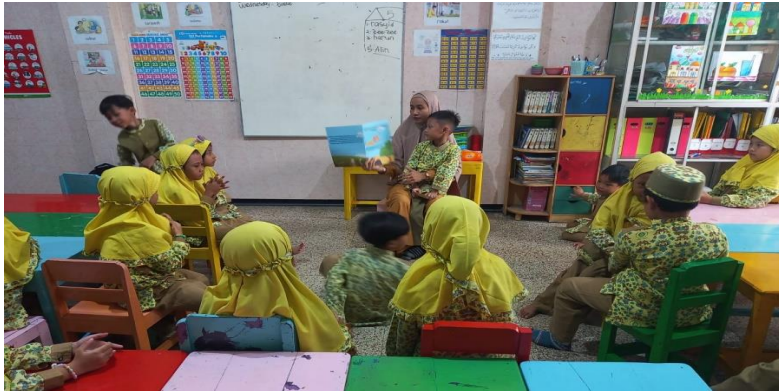
Gambar 11. Guru melakukan read aloud and singing tema tolong menolong

and Singing yang diterapkan pada guru di kelas. Guru membacakan cerita dengan lantang agar semua anak bisa mendengar isi cerita yang ada di buku, selain membacakan cerita guru juga menyelingi nyanyian agar menambah semangat anak untuk mendengarkan. Lagu yang dinyanyikan guru juga terkait dengan lagu-lagu bullying . Hal tersebut dilakukan agar anak-anak lebih mudah memahami hal-hal yang boleh dan tidak boleh dilakukan kepada teman lainnya. Berikut merupakan foto hasil penerapan Read Aloud and Singing oleh guru kelas.