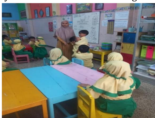
Gambar 3. Guru menasehati anak yang melakukan tindakan bullying verbal

Korban bullying verbal juga merupakan korban bullying secara fisik. Para korban adalah anak yang memiliki rasa percaya diri yang rendah, pola pengasuhan yang salah, kurang mampu bersosialisasi dan berinteraksi dengan teman-temannya. Anak yang pernah menjadi korban bullying verbal cenderung kesulitan membentuk hubungan social yang sehat, rasa percaya diri rendah dan mengalami trauma social seperti sulit mengekspresikan emosinya dengan tepat [12]. Anak-anak yang memiliki rasa percaya diri rendah disebabkan karena sering mengalami kekerasan verbal dalam keseharian di rumah. Orang tua yang sering merendahkan, menghina anak bila melakukan kesalahan atau tidak mencapai ekspektasi yang diharapkan orang tua, membuat sebagian anak merasa minder dan tidak percaya diri untuk berinteraksi dengan orang lain.