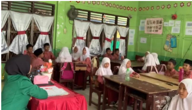
Gambar 2. Pembelajaran dengan metode Course Review Horay (CRH)

Terdapat perbedaan pada indikator kemampuan menyimak antara kelas eksperimen dan kelas kontrol. Hal ini menunjukkan bahwa siswa yang mengikuti pembelajaran menggunakan metode pembelajaran Course Review Horay (CRH) memiliki kemampuan menyimak yang lebih baik daripada siswa yang mengikuti metode pembelajaran konvensional. Penggunaan metode pembelajaran Course Review Horay (CRH) membuktikan memiliki pengaruh yang lebih baik dibandingkan dengan metode pembelajaran konvensional.