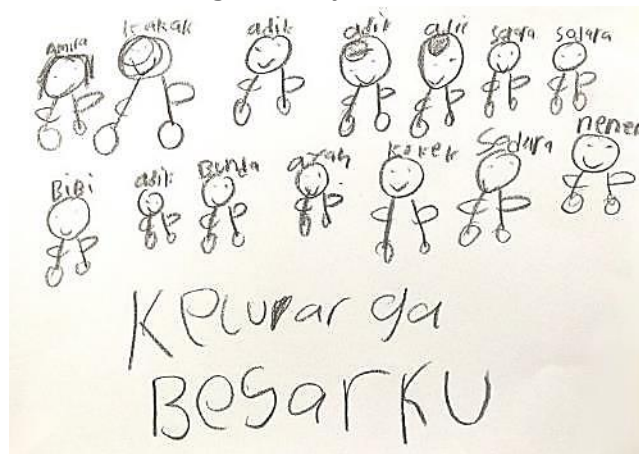
Gambar 3. Gambar Anak G-2 oleh Subyek C-2

Pada gambar G-1 yang digambarkan oleh subyek C-1, tampak 6 sosok anggota keluarga di dalamnya. Seluruh anggota keluarga tersebut digambarkan berjenis kelamin perempuan yang tidak memiliki tangan. Setiap sosok tersebut juga digambarkan memiliki rambut panjang lurus dan tegas. C-1 tidak menyertakan sosok anggota keluarga laki-laki di dalam gambarnya, seperti menyertakan sosok ibu tetapi sosok ayah tidak, menyertakan sosok nenek namun kakek tidak, dan menyertakan bibi namun paman tidak. C-1 mengaku lupa dan tidak terpikirkan untuk menggambarkan sosok anggota keluarga laki-laki di dalam gambarnya.