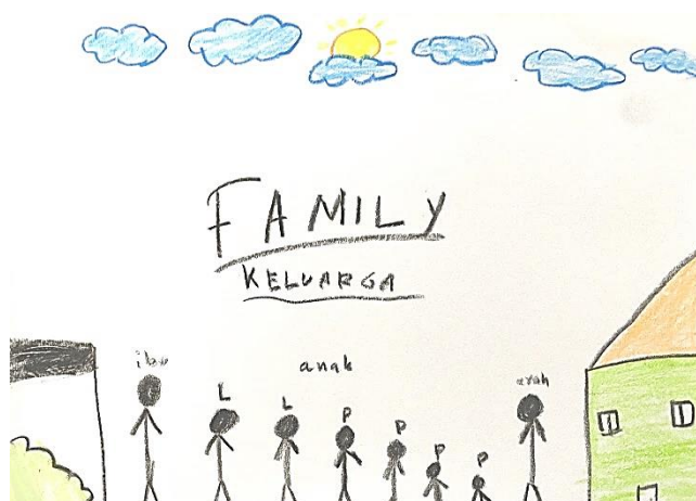
Gambar 4. Gambar Anak G-3 oleh Subyek C-3

Berbeda dengan C-1 dan C-2 yang menggambarkan lebih banyak anggota keluarga pada gambarnya. C-2 menggambar sosok ibu terlebih dahulu, kemudian 2 sosok kakak laki-laki (yang dia lambangkan dengan huruf L), lalu 2 orang kakak perempuan (2 huruf P pertama), me-figure (P ketiga), seorang adik perempuan (P terakhir), lalu yg terakhir adalah Sosok ayahnya. Dia menjelaskan bahwa keluarganya sedang berada di halaman rumahnya, yang dia gambarkan sebagai background (rumah, semak, bendera, awan dan matahari).