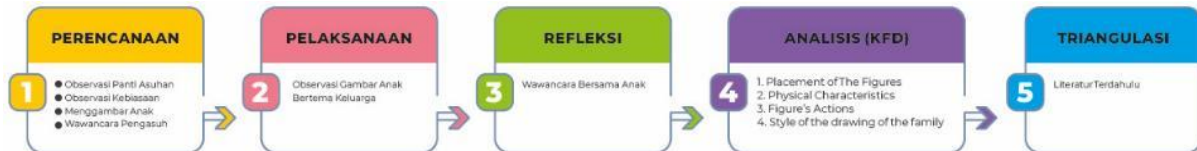
Gambar 1. Kerangka Penelitian Gambar Anak

Seluruh kegiatan penelitian didokumentasikan sebagai pendukung keabsahan data yang telah dikumpulkan. Dan sebagai pendukung serta referensi dalam proses analisis, kemudian diperlukan data-data pendukung melalui dokumen-dokumen dari hasil penelitian terdahulu.