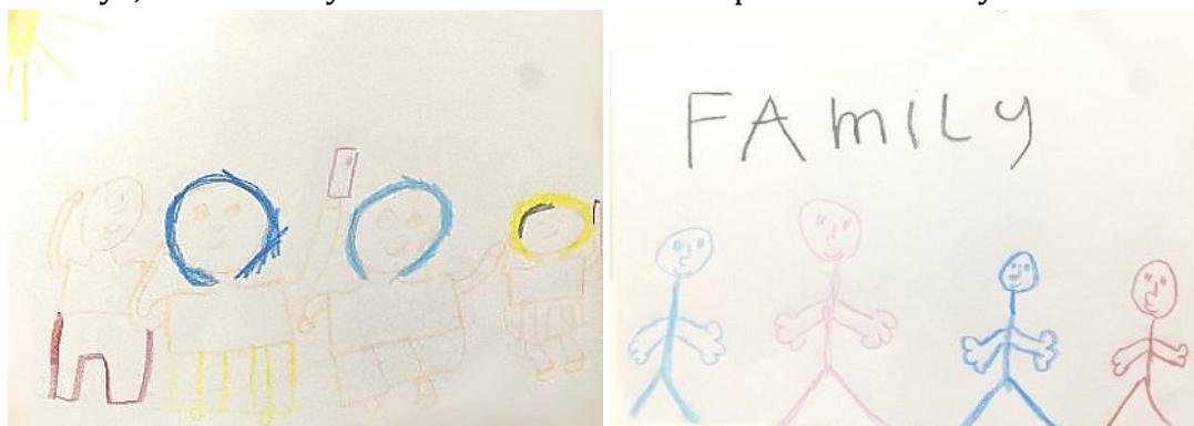
Gambar 5. Gambar Anak G-4 oleh Subyek C-4 (kiri) dan Gambar G-5 oleh C-5 (kanan)

Seperti yang tampak pada gambar G-3, C-3 menggambarkan sosok anggota keluarganya dengan gambar stickman berwarna hitam dan tanpa aksesoris apapun. Sosok adik selalu tampak lebih kecil dari kakaknya. Sosok kakak tertua lebih kecil dari sosok ibunya, dan sosok ayah terlihat lebih kecil daripada sosok ibunya.