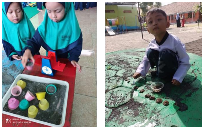
Gambar 2. Bermain dengan pasir

Pendidikan anak usia dini merupakan institusi prasekolah yang selalu mempertimbangkan perkembangan pada anak usia dini. Pada hakikatnya anak usia dini sangat suka bermain dan belajar dengan konkrit, oleh sebab itu pembelajaran diPAUD selalu menerapkan pembelajaran yang mengasyikkan, menyenangkan dengan menggunakan media yang beragam. Sebagaimana yang disampaikan oleh Bunda Umi dalam interview, 2024 mengatakan bahwa media yang digunakan dalam pembelajaran di RA Umi sundari menggunakan media loose part dari bahan.barang atau benda dari alam sekitar sekolah, dengan penggunaan media tersebut anak lebih senang mengeksplorasi keinginan anak, menyalurkan kreatifitas, dan literasi mengenal berbagai nama-nama benda yang digunakan untuk bermain pasir. sependapat dengan itu media loose part selalu digunakan dalam proses pembelajaran, Hal ini disebabkan oleh keluesannya dalam setiap pelajaran, kemudahannya dalam menggunakannya dalam permainan, dan disenangi anak. Selain itu, media loose part ini juga memberikan kebebasan kepada anak untuk menuangkan ide, kreativitas, dan imajinasinya ke dalam kegiatan [4]. Kegiatan penggunaan media tersebut dapat dilihat pada gambar dibawah ini.