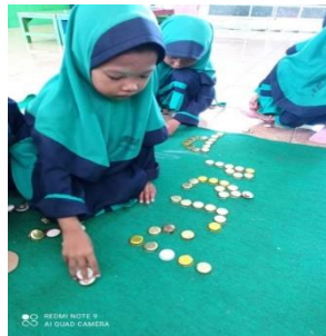
Gambar 3. Menulis kata dengan loose part

Pendapat bunda umil dari wawancara tahun 2024 juga mengatakan bahwa dilembaga RA Umi Sundari telah menggunakan media loose part dalam kegiatan belajar mengajarnya. Kegiatan pembelajaran yang bertujuan untuk mengembangkan bahasa dan literasi anak dengan cara Tanya jawab dan diskusi tentang alat atau bahan loose part yang ditunjukkan guru didepan kelas dan menulis menggunakan media loose part seperti pada gambar dibawah ini.