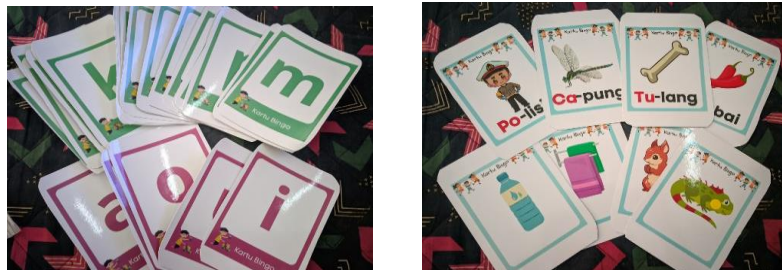
Gambar 3. Kartu Bingo Huruf dan Bergambar

Media Papan Bingo diharapkan akan meningkatkan kemampuan membaca permulaan anak-anak sehingga 70% dari seluruh anak usia dini di kelompok B TK