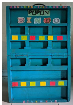
Gambar 2. Media Papan Bingo

Pra Siklus, sebelum memulai proses tindakan, peneliti melakukan pengamatan awal atau pra-siklus. Langkah pertama dalam penelitian tindakan kelas (PTK) disebut tahap pra-siklus, dimana kegiatan hanya terfokus pada observasi dan refleksi, tanpa perencanaan kegiatan yang detail. Pada tahap ini, pengamatan difokuskan pada metode pengajaran guru dan keterlibatan siswa selama pembelajaran. Pada tahap pra-siklus, hasil observasi menunjukkan terdapat beberapa anak yang belum mencapai kemampuan membaca permulaan yang optimal, ditandai dengan kesulitan membedakan huruf "b" dengan "d" dan "m" dengan "w" karena keserupaan bentuk huruf-huruf tersebut. Dari total 17 anak di kelompok B di TK Aisyiyah Bustanul Athfal 3 , 10 orang diantaranya menunjukkan kemampuan membaca permulaan pada kategori mulai berkembang. Untuk membantu anak mengembangkan kemampuan membaca permulaan mereka digunakan media Papan Bingo yakni media berupa papan yang dimodifikasi khusus untuk anak-anak yang dilengkapi dengan kartu bingo bergambar, dengan penggunaanya dirancang dalam beberapa tahapan.