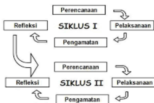
Gambar 1. Tahap Penelitian Tindakan Kelas