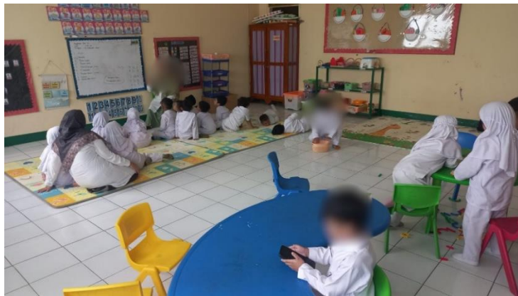
Gambar 2. Anak bermain gadget di dalam kelas

Meskipun guru telah mencoba memberikan pemahaman yang lebih kepada J, namun J terus menggunakan gadget di kelas tanpa memperhatikan atau mendengarkan apa yang dikatakan oleh guru. Sikap ini menunjukkan bahwa J telah terbiasa dengan menggunakan gadget . Penggunaan gadget -nya dan sulit untuk mengubah kebiasaan tersebut. Akibatnya, guru terkadang terpaksa untuk memperbolehkan J untuk tetap bermain gadget di kelas dan berusaha menjaga suasana pembelajaran tetap kondusif. atau menyebabkan gangguan di kelas. Meskipun ini bukanlah solusi yang ideal, namun keputusan ini diambil dengan pertimbangan untuk menjaga keseimbangan suasana kelas dan memastikan bahwa pembelajaran bagi siswa lainnya tetap berjalan lancar. J terlihat lebih semakin menyendiri diantara teman-teman lainnya dan memilih terpaku pada gadget -nya. Selain itu, J lebih memilih untuk menghabiskan waktu bermain dan meminum susu dari botol pribadinya yang selalu dibawanya seperti dapat diamati pada gambar berikut: