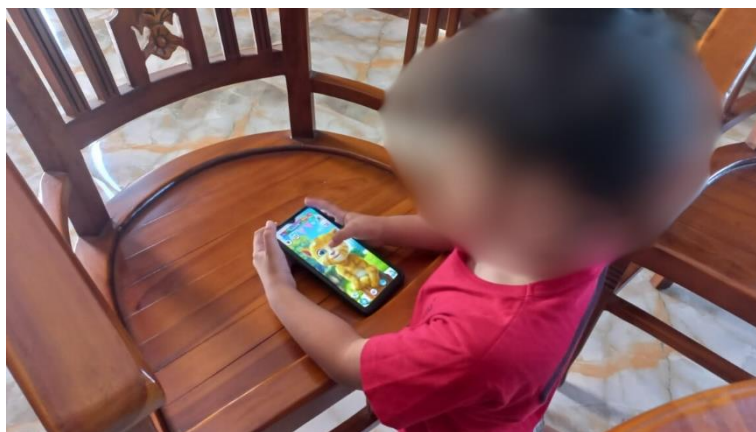
Gambar 5. Anak bermain game setiap harinya yaitu My Talking Tom Friends