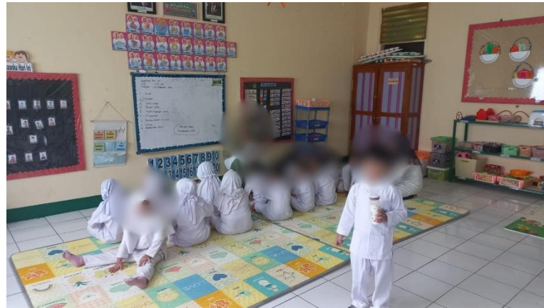
Gambar 4. Anak terlihat sedang memegang susu dari botol, sementara anak lainnya fokus pada kegiatan belajar