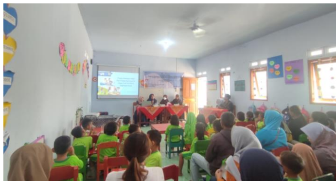
Gambar 2. Pelaksanaan Kegiatan Pengabdian kepada Masyarakat

Kegiatan workshop dilaksanakan di TK Kalongan II Ungaran Timur Kabupaten Semarang pada 5 Agustus 2023 yang dihadiri oleh peserta yang merupakan orang tua dari peserta didik TK Kalongan II Ungaran Timur Kabupaten Semarang sebanyak 36 orang. Kegiatan workshop ini bekerjasama dengan guru dan orang tua peserta didik TK Kalongan II Ungaran Timur. Pemateri dalam kegiatan workshop terkait manfaat dan pentingnya praktik play pedagogy bagi anak usia dini ini disampaikan oleh Dr. Euis Kurniati, M.Pd., seorang pakar pendidikan anak usia dini sekaligus ketua program studi Magister PAUD Universitas Pendidikan Indonesia. Selanjutnya materi disampaikan oleh Nadhira Putri Adriana, S.IP selaku mahasiswa Magister PAUD Universitas Pendidikan Indonesia, dan Aisyah Durrotun Nafisah, S.Pd. selaku mahasiswa Magister PAUD Universitas Negeri Semarang.