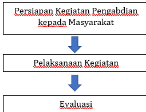
Gambar 1. Alur Kegiatan Pengabdian kepada Masyarakat

pentingnya praktik play pedagogy bagi anak usia dini yang dapat dilakukan orang tua di lingkungan rumah. Kegiatan ini dilaksanakan pada 5 Agustus 2023 di TK Kalongan II Ungaran Timur Kabupaten Semarang, dengan peserta yang merupakan orang tua dan peserta didik dari TK Kalongan II Ungaran Timur Kabupaten Semarang sebanyak 36 orang. Secara umum, kegiatan ini dilakukan dalam tiga tahap, yakni persiapan, pelaksanaan dan evaluasi sebagaimana tertuang pada gambar berikut: