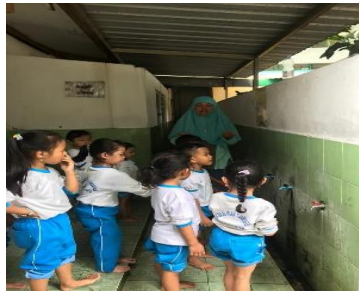
Gambar 2. Kegiatan Berwudhu

juga termasuk rukun islam yang ke-2 di agama islam, tetapi tidak sah jika wudhunya tidak sempurna. Maka, anak dilatih untuk terbiasa berwudhu ketika ingin melaksanakan sholat.