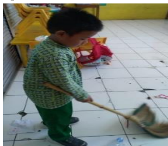
Gambar 4. Kegiatan Piket Kelas

Keempat, Kegiatan Piket Kelas, Kegiatan piket kelas juga termasuk menjaga kebersihan. Orang itu harus bertanggungjawab atas perbuatannya. Jadi, setiap orang akan dimintai pertanggungjawaban atas perbuatannya. Hal ini anak dilatih untuk bertanggungjawab melalui kegiatan piket kelas.