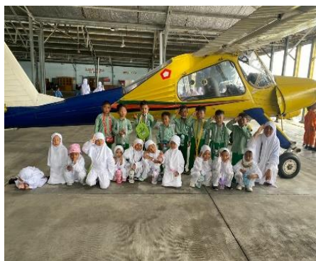
Gambar 1. Kegiatan Manasik Haji

Pertama, Manasik Haji, kegiatan manasik haji ini, anak akan mengerti bahwa haji itu merupakan kewajiban umat muslim bagi yang mampu. Maka dari itu dikenalkan sejak dini.