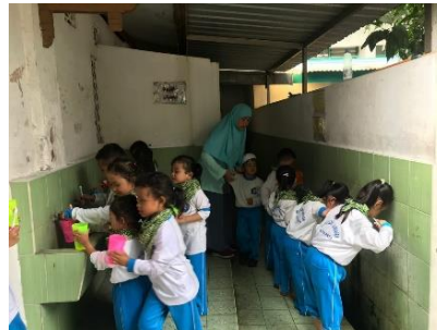
Gambar 3. Kegiatan Menggosok Gigi

Ketiga, kegiatan menggosok gigi, kegiatan menggosok gigi dan piket kelas adalah sebagai “Annadhafatu Minal Iman” yang berarti kebersihan itu sebagian dari iman, karena menjaga kebersihan gigi itu juga penting untuk Kesehatan gigi dan mulut.