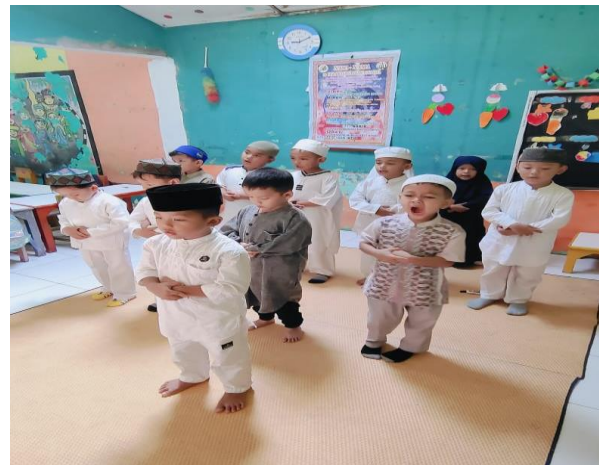
Gambar 1. Dokumentasi kegiatan pengembangan nilai agama dan moral anak

Hasil penelitian terkait kegiatan yang dilakukan di RA Permata dalam mengoptimalkan nilai agama dan moral anak menunjukkan bahwa sekolah telah menyiapkan kegiatan-kegiatan keagamaan yang juga akan mempengaruhi moral anak. Kegiatan tersebut rutin dilakukan. Sebagiannya dilakukan sebelum memulai pembelajaran, sebagian lainnya di jam belajar dan ketika sebelum pulang. Kegiatan-kegiatan tersebut terbukti berhasil meningkatkan nilai agama dan moral anak. Dapat dilihat dari jumlah anak yang mampu mengikuti kegiatan tersebut dengan baik. Berdasarkan hasil pengamatan yang peneliti lakukan melalui observasi dan wawancara kepada guru mengenai perkembangan Agama dan moral anak dipaparkan pada tabel berikut :