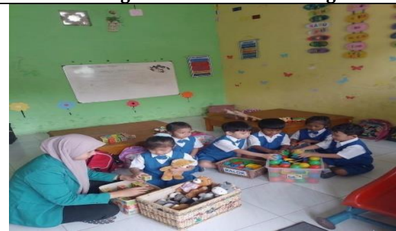
Gambar 6. menyimpan barang pada tempatnya secara mandiri.

Berdasarkan hasil observasi, anak telah mampu memakai sepatu dan mencuci tangan secara mandiri sebagaimana ditunjukkan pada Gambar 1 dan Gambar 2. Dokumentasi kegiatan juga menunjukkan bahwa anak terbiasa membersihkan peralatan makan dan menyimpan barang pada tempatnya secara mandiri (Gambar 3 dan Gambar 4).