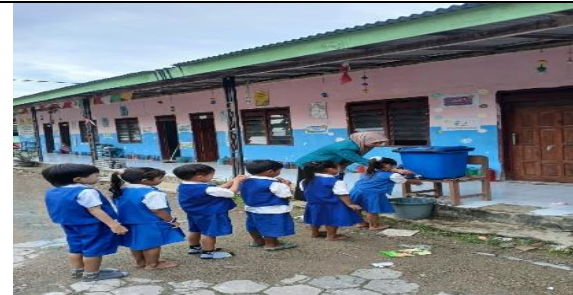
Gambar 4. kegiatan anak mencuci tangan