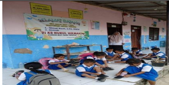
Gambar 3. Kegiatan anak memakai sepatu

Selain itu, kegiatan sopan santun sosial ( grace and courtesy ) dilaksanakan melalui pembiasaan mengucapkan salam, mengucapkan terima kasih, meminta izin, meminta maaf, menunggu giliran, dan membantu teman yang mengalami kesulitan. Hasil observasi menunjukkan bahwa perilaku tersebut telah menjadi bagian dari interaksi sehari-hari anak di lingkungan sekolah. Kepala TK Bina Kalam menjelaskan: "Kemandirian tidak hanya berarti anak mampu melakukan sesuatu sendiri, tetapi juga mampu bertanggung jawab terhadap dirinya dan menghargai orang lain. Karena itu, pembiasaan sopan santun juga menjadi bagian dari practical life activity di sekolah ini." (Wawancara, 20 Januari 2026).