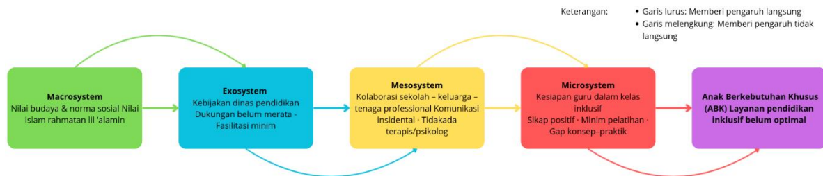
Gambar 5. Model konseptual hasil penelitian

Berdasarkan temuan penelitian ini, hubungan antar sistem dalam penerapan Pendidikan inklusif PAUD di Sulawesi dapat digambarkan secara konseptual. Model konseptual berikut menunjukkan bagaimana keempat sistem microsystem , mesosystem , exosystem , dan macrosystem saling mempengaruhi dan membentuk kualitas layanan Pendidikan inklusif yang diterima oleh anak berkebutuhan khusus.