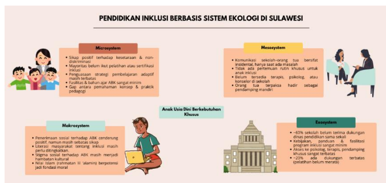
Gambar 4. Pendidikan inklusif berbasis ekologi di wilayah Sulawesi

Dalam perspektif Islam, kondisi ini menyimpan potensi yang belum tergarap. Landasan teologisnya kuat: QS. 'Abasa 80: 1-10 mengisahkan teguran Allah kepada Nabi Muhammad SAW karena berpaling dari Abdullah bin Ummi Maktum yang tunanetra, menegaskan hak setara penyandang disabilitas atas perhatian dan pendidikan [34]. Nilai fitrah yang diajarkan Islam juga menegaskan bahwa setiap anak terlahir dengan potensi yang diberikan Allah SWT, sehingga ABK pun memiliki keistimewaan yang layak dikembangkan melalui pendidikan yang inklusif [8]. Karena itu, penguatan literasi inklusi di PAUD Sulawesi idealnya berlandaskan nilai-nilai Islam tersebut, agar penerimaan sosial berkembang dari sikap normatif menjadi komitmen substantif yang mendorong perubahan sistemik.