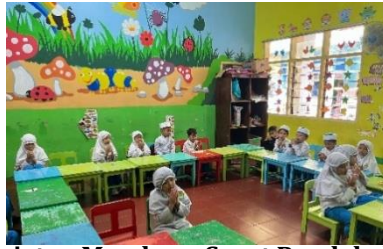
Gambar 5. Kegiatan Membaca Surat Pendek dan Doa Sebelum Makan

Strategi scaffolding dalam pembelajaran tidak hanya sekedar memberikan penguatan nilai-nilai religius pada anak, namun juga membutuhkan pembiasaan dan keteladanan guru yang konsisten. Keteladanan dan pembiasaan merupakan dua pilar utama dalam memperkuat nilai-nilai dengan didukung dari guru, lingkungan dan orangtua [18]. Dalam kegiatan membaca surat pendek dan membaca doa sebelum makan merupakan bagian dari rutinitas yang dilakukan setiap hari. Guru memberikan contoh terlebih dahulu, kemudian anak mulai menirukan. Ketika ada anak yang belum menghafal atau belum tepat dalam membaca do'a atau surat-surat pendek, guru memberikan koreksi dan tidak bersifat menyalahkan atau menghakimi, sehingga anak merasa aman selama proses pembelajaran berlangsung. Kegiatan membaca surat-surat pendek dan do'a sebelum makan dijalankan melalui scaffolding yang bertahap dengan memanfaatkan ingatan anak yang berbeda-beda. Untuk surat pendek, urutan scaffolding mengikuti pola seperti bacaan oleh guru, diikuti anak sekelas, diikuti kelompok kecil, kemudian melakukannya secara mandiri atau individual (sesuai kecepatan perkembangan masing-masing anak). Untuk mengenalkan anak pada bacaan doa dan surat-surat pendek, memerlukan perencanaan pembelajaran yang mencakup sejumlah kegiatan yang bertujuan untuk menumbuhkan keimanan dan nilai-nilai Islam pada anak usia dini melalui kehidupan sehari-hari.