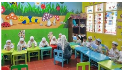
Gambar 3. Kegiatan Baca Simak Wafa

keteladanan yang menunjukkan nilai-nilai religius secara langsung serta memperkuat pembentukan karakter moral melalui interaksi yang berlangsung secara konsisten. Kegiatan baca simak Wafa dengan metode baca Simak di RA Nurul Hikmah dilaksanakan dengan menerapkan strategi scaffolding , di mana guru terlebih dahulu memberikan bimbingan klasikal sebelum anak-anak membaca secara mandiri. Metode baca simak yang digunakan memberikan kesempatan bagi peserta didik untuk mendengarkan, menirukan, dan membaca secara bergantian. Guru berperan aktif sebagai fasilitator sekaligus model bacaan yang menjadi acuan bagi anak dalam proses penguasaan kemampuan membaca Al-Qur'an.