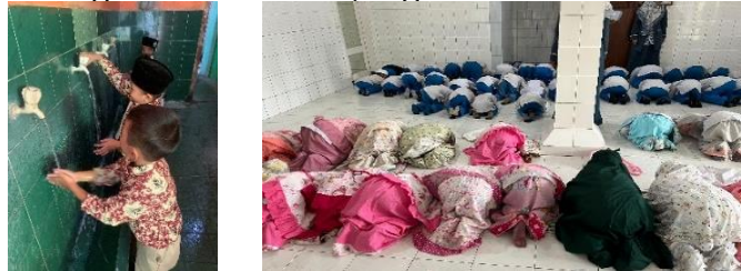
Gambar 4. Kegiatan Praktik Wudhu dan Shalat Dhuha berjamaah

tersebut mencerminkan kesadaran pedagogis guru terhadap nilai pembelajaran tidak langsung yang terjadi dalam kegiatan baca simak. Temuan ini diperkuat oleh hasil observasi peneliti yang menunjukkan bahwa dalam pelaksanaan kegiatan baca simak WAFA, anak-anak membaca secara bergiliran sementara guru memberikan penilaian langsung pada buku prestasi harian masing-masing anak. Hal ini menunjukkan bahwa teknik baca simak tidak hanya efektif secara individual, melainkan berfungsi sebagai pendukung scaffolding yang diterapkan oleh guru baik bagi anak yang sedang membaca maupun bagi anak yang sedang menyimak, sehingga seluruh anak dalam kondisi belajar yang aktif meskipun dengan keterlibatan yang berbeda-beda.