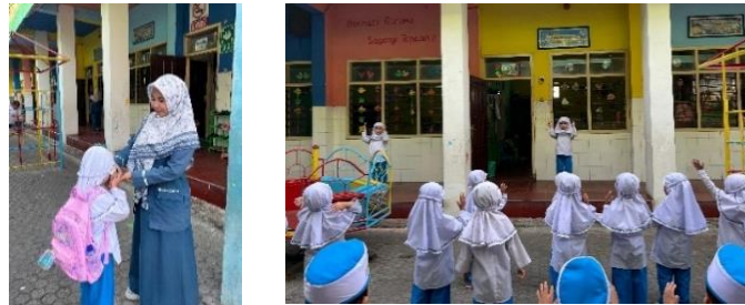
Gambar 2. Kegiatan Penyambutan dan Kegiatan Menyanyi Asmaul Husna dengan Gerakan

Hasil observasi dalam penelitian ini menunjukkan bahwa kegiatan pembelajaran religius dapat mengintegrasikan scaffolding melalui pembiasaan yang dilakukan secara konsisten dan bertahap. Guru mengatakan bahwa "...anak usia dini itu penyerapan informasinya sangat cepat, jadi harus memanfaatkan itu dengan diberikan pembiasaan-pembiasaan yang terus menerus...". Selain itu, pembiasaan yang dilakukan secara rutin dapat membantu anak mengembangkan aspek perkembangannya khususnya dalam nilai-nilai religius. Hal ini didukung oleh Ruswinarsih bahwa konsistenan dalam menanamkan pembiasaan dapat menjadikan karakter religius dalam diri siswa dan pembiasaan dilakukan dalam setiap kegiatan harian, mingguan maupun tahunan.