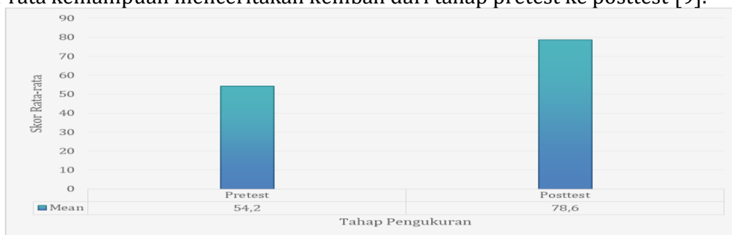
Grafik 1. Perbandingan Kemampuan Menceritakan Kembali Anak Sebelum dan Sesudah Intervensi

Pelaksanaan membaca nyaring dilakukan secara bertahap melalui kegiatan menyimak cerita, menjawab pertanyaan pemantik, mengenali tokoh, memahami alur, dan menceritakan kembali isi cerita menggunakan bahasa sendiri [25]. Kegiatan membaca nyaring yang dilakukan secara interaktif membantu anak memperoleh pengalaman bahasa yang lebih bermakna karena anak tidak hanya mendengar cerita, tetapi juga terlibat dalam dialog bersama guru [26]. Peningkatan kemampuan anak terlihat setelah beberapa kali perlakuan karena anak mulai mampu menyebutkan tokoh, menjelaskan peristiwa utama, dan menyampaikan kembali cerita dengan kalimat sederhana [27]. Hasil pengukuran melalui spss menunjukkan adanya peningkatan nilai rata-rata kemampuan menceritakan kembali dari tahap pretest ke posttest [9].