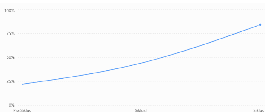
Grafik 1. Perkembangan Ketuntasan Kemampuan Mengenal Huruf Anak pada Pra Siklus, Siklus I, dan Siklus II

Berdasarkan hasil perbandingan ketuntasan klasikal, kemampuan anak usia 5–6 tahun dalam mengenal huruf terlihat berkembang secara bertahap pada setiap siklus pembelajaran. Pada tahap pra siklus, hanya 4 anak (22%) yang mencapai kategori BSH. Setelah kegiatan menggunakan kartu huruf bergambar pada Siklus I, jumlahnya meningkat menjadi 8 anak (44%). Pada Siklus II, peningkatan kembali terlihat hingga mencapai 15 anak (84%). Hasil ini menunjukkan bahwa penggunaan kartu huruf bergambar membantu anak lebih mudah mengenal huruf, lebih fokus, dan lebih antusias mengikuti kegiatan belajar. Untuk memperjelas perkembangan ketuntasan kemampuan mengenal huruf anak pada setiap siklus, data perbandingan ketuntasan klasikal juga disajikan dalam bentuk grafik berikut.