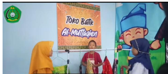
Gambar 2. Sosiodrama Membuatik