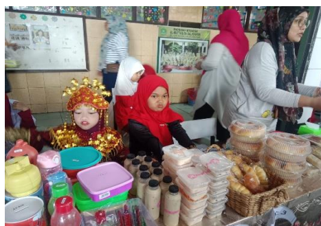
Gambar 3. Sosiodrama Jual Beli

Pengembangan Kurikulum Berbasis Media Interaktif Sosiodrama. Penelitian ini mengungkapkan bahwa pengembangan kurikulum yang melibatkan media interaktif sosiodrama di RA Al-Muttaqien Balikpapan dilakukan dengan menggabungkan aktivitas bermain peran dan penggunaan alat bantu pembelajaran interaktif dalam setiap tema. Para guru merancang kegiatan yang mencakup simulasi sosial, percakapan sederhana, pemanfaatan boneka tangan, video pembelajaran, kartu peran, serta media visual