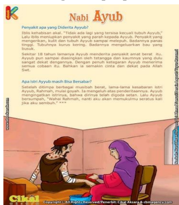
Gambar 3. Tangkapan layar buku anak Kisah Menakjubkan 25 Nabi dan Rasul

Lebih jauh, kisah Isrā'iliyyāt Nabi Ayyub juga hadir dalam media yang diperuntukkan bagi anak usia dini, sehingga sejak dini anak-anak telah diperkenalkan dengan narasi yang bermasalah secara teologis. Salah satu buku kisah nabi untuk anak yang memuat Isrā'iliyyāt Nabi Ayyub yaitu yang ditulis Nurul Ihsan, dan diterbitkan oleh Cikal Aksara dengan judul Kisah Menakjubkan 25 Nabi dan Rasul . Pada halaman 38, Nabi Ayyub dinarasikan dengan penderitaan penyakit yang mengerikan, kulit dan tubuhnya sampai melepuh. Badannya demam tinggi, dan mengeluarkan bau busuk [16]. Dalam YouTube Kids, yakni aplikasi YouTube yang diperuntukkan untuk anak-anak, kisah Isrā'iliyyāt Nabi Ayyub juga dijadikan sebagai bahan konten untuk mereka. KABI-Kisah Teladan Nabi adalah kanal YouTube Kids yang mengunggah. Video dengan judul Kisah Nabi Ayyub – Manusia Paling Sabar | Kisah Teladan Nabi | Cerita Islami | Cerita Anak Muslim telah ditonton sebanyak lebih 3,6 juta kali penayangan. Lengkap dengan animasi yang menarik. Nabi Ayyub dinarasikan dan digambarkan sebagai nabi yang diuji dengan seluruh badan yang tiba-tiba mengeluarkan nanah dari kulit kepala hingga kaki, sehingga tidak bisa bergerak [17].