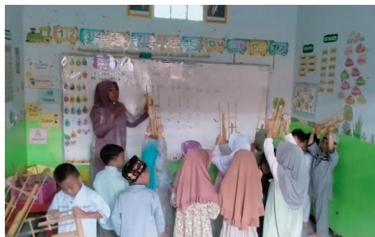
Gambar 3. Kegiatan siklus 1

Hasil penelitian ini sejalan dengan penelitian [20] yang menyatakan bahwa pembelajaran berbasis music dapat membantu mengembangkan kemampuan bahasa anak usia dini melalui kegiatan yang aktif dan menyenangkan. Selain itu, penelitian [21] juga menunjukkan bahwa kegiatan music mampu meningkatkan kemampuan komunikasi dan keberanian anak dalam berbicara selama proses pembelajaran berlangsung. Anak menjadi lebih aktif dalam menyampaikan ide dan berpendapat Ketika pembelajaran dilakukan melalui kegiatan music yang melibatkan partisipasi langsung anak. Temuan penelitian lainnya ini sejalan dengan penelitian yang dilakukan oleh [22] [15]–[17] yang menyatakan bahwa kegiatan bermain musik pada anak usia dini dapat meningkatkan kemampuan berbicara dan keberanian anak dalam berkomunikasi. Penelitian tersebut menunjukkan bahwa penggunaan alat musik dalam pembelajaran mampu menciptakan suasana belajar yang menyenangkan sehingga anak lebih aktif dalam menyampaikan ide dan pendapatnya. Namun demikian, hasil pada siklus I belum mencapai indikator keberhasilan penelitian karena masih terdapat beberapa anak yang berada pada kategori Belum Berkembang (BB) dan Mulai Berkembang (MB). Oleh karena itu, peneliti melakukan refleksi terhadap pelaksanaan tindakan pada siklus I untuk memperbaiki kegiatan pembelajaran pada siklus II.