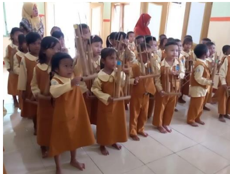
Gambar 2. Dokumentasi Kegiatan pra-siklus

Pada siklus I, guru mulai menerapkan kegiatan bermain musik menggunakan alat musik angklung dalam proses pembelajaran. Pada tahap perencanaan, peneliti Menyusun RPPH berbasis bermain musik, menyiapkan alat musik angklung, kartu huruf, gambar, dan lembar observasi perkembangan Bahasa anak. Pembelajaran dirancang dalam bentuk kegiatan bermain sambil bernyanyi agar anak merasa senang dan tidak tertekan selama mengikuti pembelajaran. Pada tahap pelaksanaan tindakan, anak dikenalkan dengan cara memegang dan memainkan angklung secara sederhana. Guru memberikan contoh cara memainkan angklung, kemudian anak diminta mengikuti instruksi guru secara bergantian. Guru juga mengajak anak bernyanyi Bersama sambil memainkan alat musik angklung. Selain itu, guru melatih anak menyebutkan nama-nama bunyi, warna, dan kosa kata sederhana yang berkaitan dengan kegiatan pembelajaran. Kegiatan dilakukan secara berulang agar anak lebih mudah memahami dan mengingat kosa kata baru.