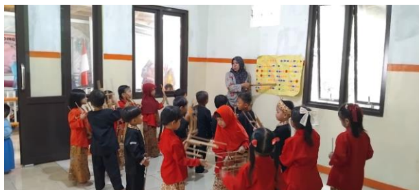
Gambar 4. Kegiatan Siklus II

kesempatan untuk mendengar, meniru, dan mengucapkan bahasa secara langsung melalui aktivitas bermain. Selain itu penelitian [25] menjelaskan bahwa penggunaan alat musik angklung dalam pembelajaran anak usia dini dapat membantu meningkatkan kemampuan bahasa dan interaksi verbal anak selama kegiatan langsung. Anak menjadi lebih aktif dalam berkomunikasi Ketika pembelajaran dilakukan melalui aktivitas yang menyenangkan dan melibatkan partisipasi langsung anak.