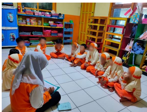
Gambar 3. Proses pembelajaran dan hafalan surat pendek

yang berbeda. Latihan yang cukup akan membantu anak mencapai penguasaan materi secara optimal.