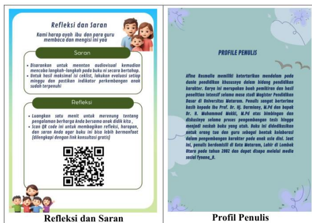
Gambar 4. Bagian 3 Parenting Handbook

Bagian 3, dan yang terakhir adalah bagian 3 yaitu penutup, ini terdiri dari saran dan refleksi yang disertai dengan link laman google form yang dapat diakses orang tua untuk memberikan feedback yang kemudian diarahkan pada akses konsultasi terkait parenting.