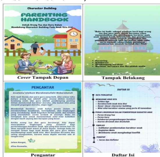
Gambar 2. Bagian 1 Parenting Handbook

Bagian 1, bagian pertama alam struktur buku ini merupakan bagian pendahuluan ( front matter ) yang mencakup elemen-elemen formal seperti halaman judul (cover), kata pengantar, dan daftar isi sebagai pengantar sebelum memasuki naskah utam, desain ini dapat dilihat pada gambar 2 di bawah ini;