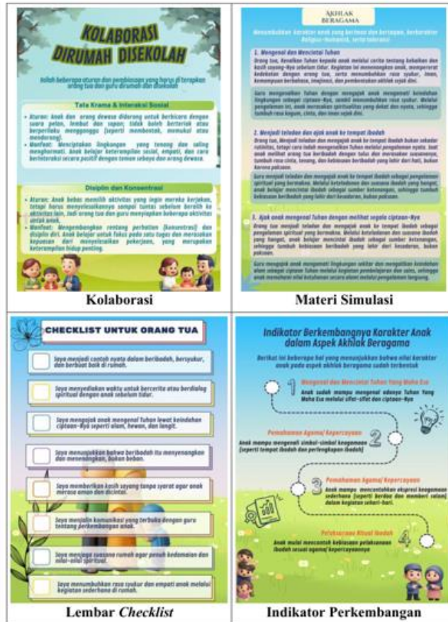
Gambar 3. Bagian 2 Parenting Handbook

Bagian 3, dan yang terakhir adalah bagian 3 yaitu penutup, ini terdiri dari saran dan refleksi yang disertai dengan link laman google form yang dapat diakses orang tua untuk memberikan feedback yang kemudian diarahkan pada akses konsultasi terkait parenting.