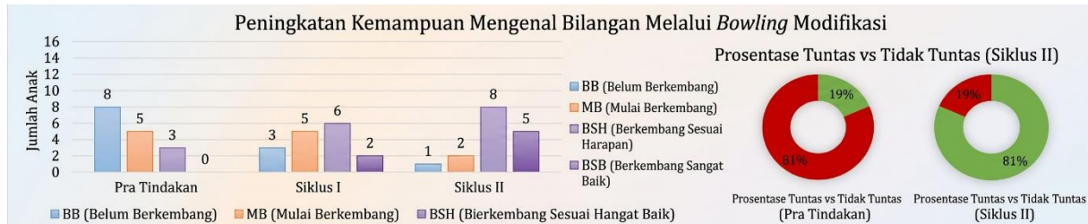
Gambar 2. Tren Peningkatan Kemampuan Numerasi Anak

Gambar 2) sejalan dengan temuan [10], [15], dan [16], yang juga menyimpulkan bahwa permainan bowling sangat efektif untuk mengenalkan konsep matematika dasar pada anak usia dini. Dengan kata lain, keberhasilan pada siklus II menegaskan pentingnya keselarasan antara media, metode, dan karakteristik perkembangan anak.