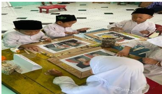
Gambar 2. Kegiatan anak

mengekspresikan diri melalui kegiatan bermain bebas dengan bahan-bahan alam yang tersedia di lingkungan sekitar.