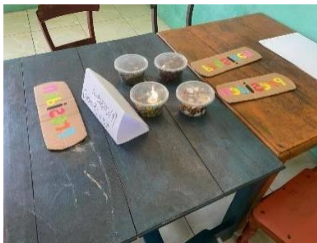
Gambar 3. Penataan media bahan Loose Parts

Media loose parts dapat memberikan kesempatan kepada anak untuk bereksplorasi tanpa batas, menciptakan sesuatu sesuai dengan imajinasi mereka sendiri, serta belajar memecahkan masalah melalui kolaborasi bersama teman sebaya. Hal ini sejalan dengan pendapat Vygotsky, yang menyatakan bahwa perkembangan sosial dan kognitif anak terjadi melalui interaksi sosial dalam zona perkembangan proksimal ( Zone of Proximal Development/ZPD ) [13]. Dalam konteks ini, pendidik berperan sebagai scaffolding yang membantu anak mencapai potensi tertingginya melalui bimbingan dan kerja sama saat bermain menggunakan media loose parts .