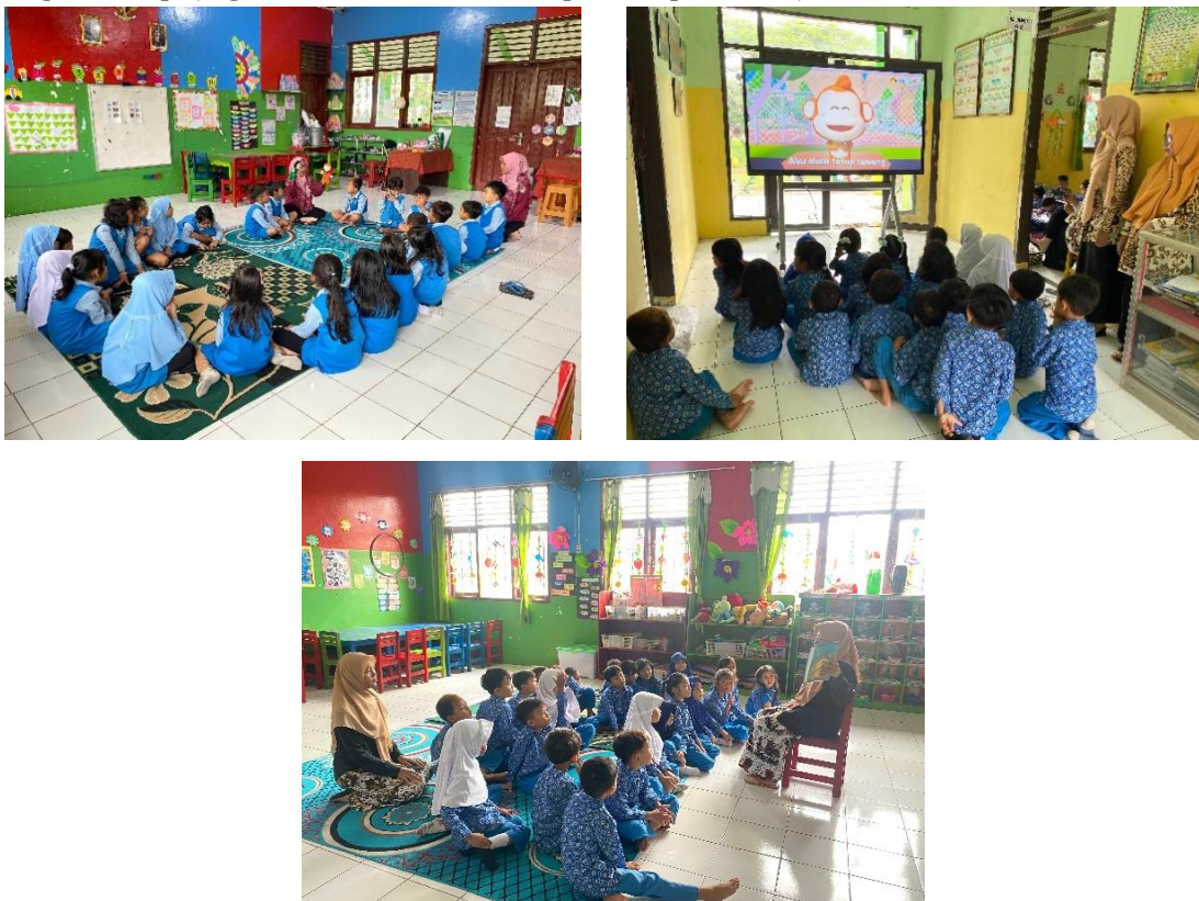
Gambar 2. Kegiatan Bercerita Kelompok B2

(Ortu P). Media audiovisual membantu meningkatkan perhatian anak, sehingga pesan yang disampaikan dalam cerita lebih mudah dipahami dan diingat. Dengan demikian, media pembelajaran berperan sebagai penguat dalam proses penanaman nilai sosial-emosional pada anak usia dini. Teknik bercerita dapat dilakukan salah satunya melalui kegiatan membaca buku cerita [21]. Penggunaan media audiovisual seperti video juga dapat mendukung kegiatan bercerita karena mampu menarik perhatian anak serta membantu mereka memahami isi cerita [22]. Selain itu, tahap dalam kegiatan bercerita meliputi persiapan media pembelajaran, pengenalan cerita, partisipasi anak, serta pengembangan cerita [5]. Melalui tahapan tersebut anak tidak hanya berperan sebagai pendengar, tetapi juga terlibat aktif dalam proses pembelajaran.