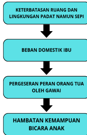
Gambar 4. Model Hubungan Antar Variabel

Berdasarkan ilustrasi pada Gambar 4, menampilkan model konseptual yang menggambarkan hubungan antara kondisi lingkungan dan perkembangan kemampuan bicara anak. Model ini menunjukkan bahwa hambatan bicara pada anak di hunian vertikal bukanlah peristiwa tunggal, melainkan hasil dari rangkaian faktor yang saling berkaitan. Keterbatasan ruang menjadi pemicu awal yang meningkatkan beban domestik serta tekanan pada orang tua. Dalam situasi tersebut, peran orang tua cenderung bergeser dengan mengandalkan media digital sebagai cara praktis untuk menjaga anak tetap tenang dan terhibur. Dampaknya, interaksi verbal dua arah antara orang tua dan anak menjadi sangat terbatas, sehingga mengurangi stimulasi bicara dan berkontribusi pada munculnya hambatan kemampuan bicara anak. Alur dalam model tersebut menunjukkan bahwa keterbatasan ruang tidak hanya berdampak pada pergeseran peran orang tua, tetapi juga memengaruhi pengalaman bermain dan interaksi anak dalam keseharian. Ruang gerak yang sempit membatasi kesempatan anak untuk beraktivitas secara bebas serta membangun komunikasi dengan lingkungan sekitar, sehingga ruang sosial yang mendukung perkembangan bicara menjadi semakin berkurang. Keterbatasan ruang gerak yang diakibatkan oleh tingginya kepadatan hunian serta minimnya fasilitas bermain yang layak mampu mengisolasi anak secara fisik maupun sosial [15].