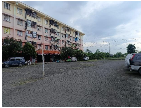
Gambar 2. Lapangan di Area Akses Kendaraan dan Parkir Rumah Susun.

Keterbatasan ini menyebabkan anak hanya bermain di sekitar koridor lantai dua yang dinilai lebih aman oleh ibu karena berada di lantai yang sama dengan rumah pengasuh anaknya dulu dan terdapat akses warung. Namun demikian, kondisi koridor yang sempit dan relatif sepi tidak memberikan ruang eksplorasi maupun stimulasi sosial yang memadai bagi anak.