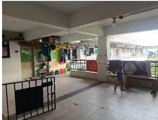
Gambar 3. Kondisi Koridor Rumah Susun

Keterbatasan ini menyebabkan anak hanya bermain di sekitar koridor lantai dua yang dinilai lebih aman oleh ibu karena berada di lantai yang sama dengan rumah pengasuh anaknya dulu dan terdapat akses warung. Namun demikian, kondisi koridor yang sempit dan relatif sepi tidak memberikan ruang eksplorasi maupun stimulasi sosial yang memadai bagi anak.