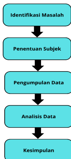
Gambar 1. Desain Penelitian

Dalam penelitian kualitatif ini, peneliti bertindak sebagai instrumen utama yang terlibat langsung dalam proses pengumpulan dan interpretasi data. Teknik pengumpulan data mencakup tiga metode utama, yakni: (1) wawancara mendalam semi-terstruktur dengan ibu K sebagai informan utama dan guru kelas sebagai informan pendukung; (2) observasi partisipatif terbatas terhadap interaksi anak di rumah dan lingkungan sekitar; serta (3) studi dokumentasi berupa dokumentasi visual kondisi tata