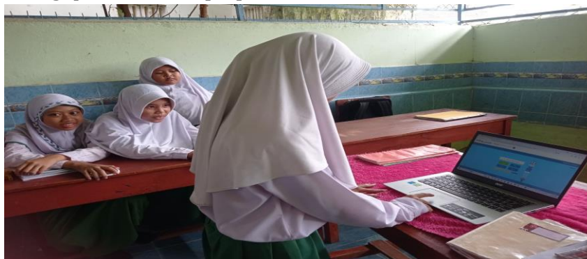
Gambar 3. Proses Penerapan Media Interaktif Educandy

demikian, Educandy dapat menjadi alternatif media pembelajaran yang inovatif, interaktif, dan mampu meningkatkan motivasi belajar siswa. Sejalan dengan penelitian yang dilakukan oleh Nurjamil, materi pembelajaran sebaiknya dikemas dengan menyesuaikan waktu yang tersedia serta media Educandy yang digunakan hendaknya mampu menjaga perhatian siswa agar tidak merasa jenuh selama proses belajar berlangsung. Dengan demikian, guru perlu merancang strategi penyampaian materi yang efisien, menarik, dan variatif, sehingga pembelajaran tetap efektif sekaligus menyenangkan bagi peserta didik [18].