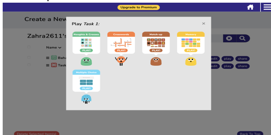
Gambar 2. Media Interaktif Educandy

Guru sebagai fasilitator pembelajaran sering kali belum maksimal dalam menjalankan perannya. Hal ini terlihat dari metode yang digunakan yang cenderung monoton, seperti ceramah, contextual teaching and learning (CTL), serta tanya jawab. Ketiga metode tersebut memang memiliki manfaat, namun jika diterapkan berulang tanpa variasi, pembelajaran menjadi kurang menarik dan tidak menantang bagi siswa. Selain itu, media pembelajaran yang digunakan juga terbatas, hanya berupa power point (PPT) sebagai penunjang. Kondisi ini menunjukkan bahwa kreativitas guru dalam memilih metode dan media masih rendah, sehingga pembelajaran kurang interaktif, inovatif, dan tidak mampu memaksimalkan potensi siswa. Untuk mengaktifkan penyajian materi, guru dapat mengkolaborasikan PPT dengan media interaktif lainnya agar pembelajaran tidak terasa membosankan. Penggunaan media interaktif mampu menciptakan suasana belajar yang lebih hidup, menyenangkan, dan sesuai kebutuhan siswa. Salah satu contoh media interaktif yang dapat dimanfaatkan adalah Educandy , yang menghadirkan pembelajaran berbasis permainan sehingga siswa lebih termotivasi, aktif, dan terlibat dalam proses belajar. Dengan demikian, peran guru sebagai fasilitator dapat berjalan lebih optimal.