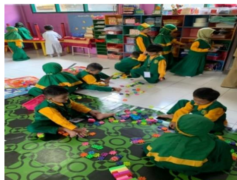
Gambar 3. MPLS Kelas A2

Data visual yang ditampilkan menjadi bukti nyata keberhasilan pelaksanaan masa transisi selama sepuluh hari. Berbagai masalah yang biasanya muncul saat anak pertama kali masuk sekolah secara bertahap menunjukkan perubahan positif. Perubahan ini terlihat pada beberapa aspek perkembangan anak. Pada aspek adaptasi emosional, anak-anak yang awalnya cemas, seperti menangis saat berpisah dari orang tua, kini lebih mandiri dan merasa nyaman di kelas. Anak dapat mengikuti kegiatan tanpa pendampingan orang tua dan menunjukkan emosi yang lebih stabil selama pembelajaran. Pada aspek kepercayaan diri dan interaksi sosial, rasa takut terhadap lingkungan baru telah berubah menjadi rasa ingin tahu yang tinggi [42].