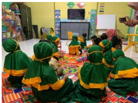
Gambar 2. MPLS Kelas A1