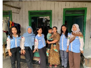
Gambar 2. Hasil Wawancara dari keluarga RH