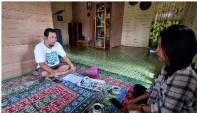
Gambar 1. Hasil Wawancara dari keluarga RY

Temuan penelitian tentang “naik ayun” merupakan upacara yang dilakukan agar anak diberi keselamatan, kesehatan dan keberkahan dan juga terhindar dari gangguan. Tradisi ini juga menjadi rasa Syukur keluarga kepada Tuhan atas kelahiran anak. Upacara biasanya di sertai dengan doa-doa, serta perlengkapan seperti ayunan kain, bunga, beras kuning. Bayi akan di ayun secara perlahan oleh orang tua atau ketua adat sambil di panjatkan doa.