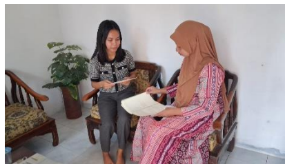
Gambar 3. Hasil Wawancara dari keluarga NR

Dari beberapa penyajian data pola pengasuhan etnis Kutai di atas, terlihat bahwa pengasuhan anak usia prasekolah yang digunakan adalah pola asuh demokratis dan masih terdapat nilai-nilai budaya Kutai dari nenek moyang yang diturunkan secara turun temurun. Ini menunjukkan bahwa budaya Kutai masih terjaga hingga hari ini. Nilai-nilai budaya memiliki peran penting dalam mengelola sekolah dan lingkungan belajarnya, serta memengaruhi para guru, siswa, dan dunia pendidikan [22]. Selain itu, temuan pengasuhan dalam keluarga Etnis Kutai merupakan salah satu pengasuhan demokratis. Pola asuh demokratis menunjukkan hubungan yang terbuka antara orang tua dan anak, di mana mereka bersama-sama menentukan aturan yang disepakati oleh kedua belah pihak. Anak-anak diberi kebebasan untuk menyampaikan pendapat, perasaan, dan keinginan mereka, sekaligus belajar untuk menghormati pendapat orang lain [23]. Hasil penelitian menunjukkan bahwa pola asuh etnis Kutai bersifat demokratis dan tetap mempertahankan nilai budaya lokal, sejalan dengan penelitian sebelumnya yang menyatakan bahwa praktik pengasuhan dipengaruhi oleh konteks budaya dan lingkungan sosial keluarga. Hal ini sejalan dengan temuan yang mengatakan bahwa [24] pola asuh demokratis, membuat anak akan menjadi orang yang mau menerima kritik, menghargai orang lain, mempunyai kepercayaan diri yang tinggi dan mampu bertanggung jawab terhadap kehidupan sosialnya.