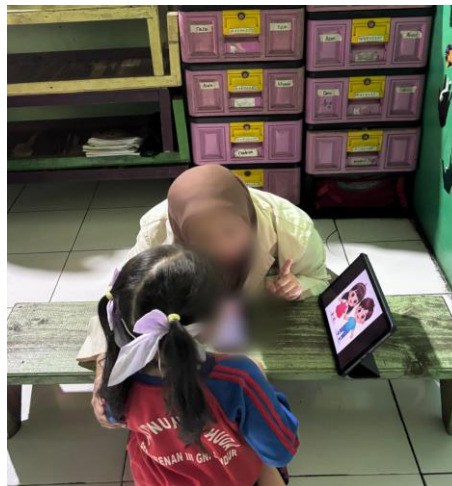
Gambar 1. Anak usia 5-6 tahun di PAUD Nurul Huda sedang menyimak media gambar tentang batasan tubuh dan perbedaan gender.

Peran Guru dalam Pengenalan Pendidikan Seksual Anak Usia Dini. Berdasarkan hasil wawancara dengan guru, diperoleh informasi bahwa pengenalan pendidikan seksual pada anak usia dini telah diintegrasikan ke dalam pembelajaran tematik, khususnya pada tema "Diriku" yang membahas anggota tubuh manusia dan perbedaan gender. Guru juga memberikan penjelasan secara langsung apabila terdapat perilaku anak yang kurang sesuai, dengan menekankan bahwa bagian tubuh tertentu merupakan bagian pribadi yang tidak boleh disentuh oleh orang lain. Namun, guru menyampaikan bahwa masih terdapat keterbatasan dalam menentukan pendekatan yang paling tepat untuk mengenalkan konsep batasan tubuh secara lebih mendalam. Pendidikan seksual pada anak usia dini masih memerlukan penguatan, baik dari segi pemahaman dan pelatihan guru, maupun dukungan metode pembelajaran yang sesuai dengan tahap perkembangan anak.