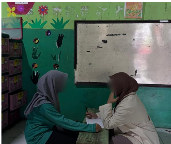
Gambar 2. Wawancara peneliti dengan guru PAUD Nurul Huda terkait penerapan pendidikan seksual pada Anak usia 5-6 tahun dalam pembelajarn tematik.

Berdasarkan hasil penelitian, anak berusia 5–6 tahun (inisial I) telah memiliki pengetahuan verbal awal mengenai batasan tubuh, yang ditunjukkan melalui kemampuannya menyebutkan bagian tubuh yang boleh dan tidak boleh disentuh oleh orang lain. Pengetahuan tersebut diperoleh dari lingkungan keluarga dan disampaikan secara sederhana, namun pemahaman anak masih bersifat dasar karena belum disertai penjelasan mengenai alasan dan makna dari batasan tubuh tersebut. Temuan ini sejalan dengan pandangan [13] yang menjelaskan bahwa anak usia dini pada umumnya telah mampu mengenali konsep awal privasi tubuh ketika memperoleh pendidikan seksual sejak dini, meskipun pemahamannya masih terbatas pada tahap pengenalan.