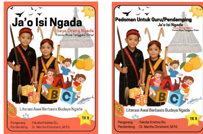
Gambar 3. Tampilan Media Buku Ja'o Isi Ngada

Secara analitik, hasil observasi dan respon guru memperkuat temuan kuantitatif sebelumnya, bahwa media tidak hanya berdampak pada hasil belajar, tetapi juga menunjukkan indikasi dukungan terhadap keterlibatan dan kelancaran proses pembelajaran. Dengan demikian, efektivitas media dapat dilihat tidak hanya dari peningkatan skor, tetapi juga dari aspek kepraktisan dan penerimaan pengguna. Meskipun demikian, hasil ini masih bersifat deskriptif dan belum didukung oleh uji statistik inferensial, sehingga interpretasi efektivitas perlu dilakukan secara hati-hati.