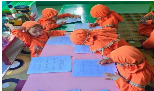
Gambar 3. Kegiatan posttest meniru huruf hijaiyah pada Lembar Kerja Anak (LKA)

Kegiatan hari ketiga adalah kegiatan treatment yaitu melakukan kegiatan penerapan media kepada anak yaitu media smart work book (wipe & clean) .