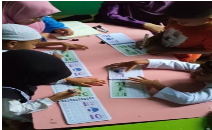
Gambar 2. Kegiatan meniru huruf hijaiyah pada media Smart work book (wipe & clean)

Kegiatan hari pertama dan kedua adalah anak memilih huruf hijaiyah dan menempel huruf hijaiyah di karton yang telah disediakan sesuai dengan huruf yang sudah ada di karton.