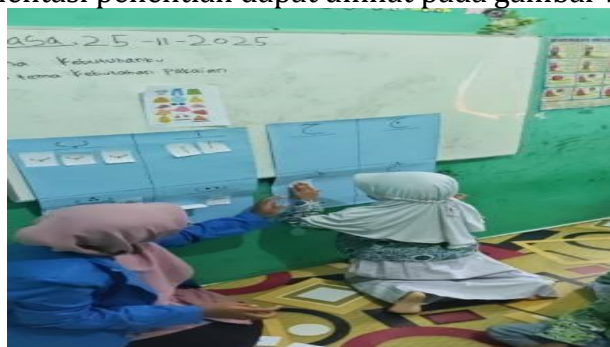
Gambar 1. Kegiatan Menempel Huruf Hijaiyah

Pengenalan huruf hijaiyah pada anak sangat penting diajarkan, mulai dari pengucapan dan penulisannya. Senada dengan kajian Zainiyah, yang menyatakan bahwa pengenalan huruf hijaiyah sejak usia dini, termasuk pengembangan kemampuan anak untuk mendengar, mengucapkan, dan menulis berbagai huruf hijaiyah [24]. Pengenalan huruf hijaiyah pada anak di sekolah RA Ahlul Qur'an semakin terlihat kemampuannya setelah dibuktikan dengan hasil yang diperoleh pretest dan posttest . Hasil rata-rata dari pretest berjumlah 2,18 dan nilai posttest berjumlah 2,85. Maka terbukti bahwa media smart work book (wipe & clean) dapat digunakan untuk mengenalkan huruf hijaiyah pada anak usia 4-5 tahun di RA Ahlul Quran berdasarkan penelitian yang sudah dilakukan. Dokumentasi penelitian dapat dilihat pada gambar berikut ini: