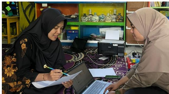
Gambar 3. Dokumentasi Wawancara dengan Wali Kelas

teman sebaya untuk menentukan urutan langkah yang tepat, sehingga mendorong kemampuan anak dalam mengemukakan pendapat dan mempertimbangkan berbagai alternatif solusi. Peran guru terlihat sebagai fasilitator yang memberikan arahan dan pertanyaan pemantik agar anak mampu menyelesaikan tugas secara mandiri sesuai dengan tingkat perkembangannya. Aktivitas ini mencerminkan pembelajaran yang berpusat pada anak dan selaras dengan prinsip belajar sambil bermain dalam pendidikan anak usia dini.