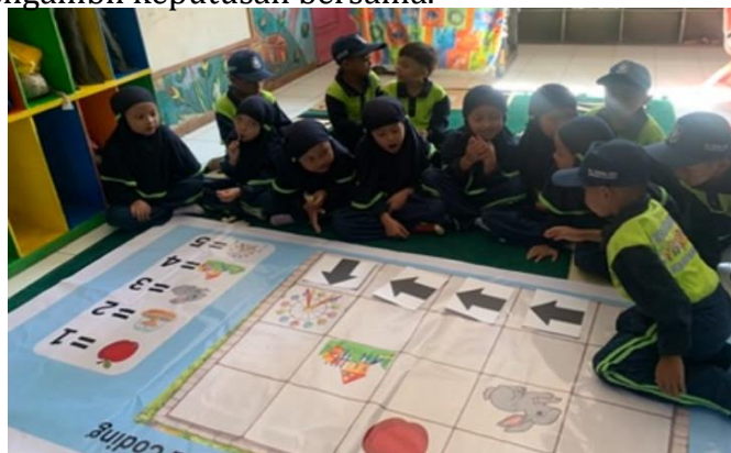
Gambar 2. Aktivitas Anak dalam Permainan Unplugged Coding

Selama implementasi permainan unplugged coding yang dilaksanakan dalam empat kali pertemuan dengan tema “Tempat Rekreasi (Alun-Alun Kota Batu)”, anak menunjukkan keterlibatan yang semakin meningkat dari satu pertemuan ke pertemuan berikutnya. Pada pertemuan pertama, anak diperkenalkan dengan kartu instruksi untuk menyusun langkah menuju tujuan, namun masih banyak yang bergantung pada arahan guru dalam menentukan urutan. Pada pertemuan kedua, anak mulai mampu mengikuti jalur yang telah disusun dan menunjukkan pemahaman awal terhadap hubungan antara instruksi dan tindakan. Pada pertemuan ketiga, anak mulai dilatih untuk memilih jalur dan memberikan alasan sederhana atas pilihan tersebut, meskipun alasan yang diberikan masih bersifat konkret dan berdasarkan pengalaman langsung. Pada pertemuan keempat, anak melakukan aktivitas secara berkelompok untuk menyelesaikan tantangan jalur menuju tujuan, dan mulai menunjukkan kemampuan berdiskusi serta mengambil keputusan bersama.