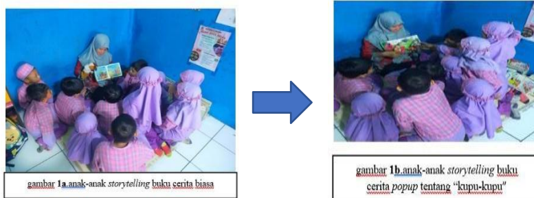
Gambar 2. Uji dalam pra-tes langsung

Grafik menunjukkan peningkatan signifikan pada hasil post-test setelah perlakuan. Seluruh anak menunjukkan peningkatan kemampuan berbicara dalam hal kelancaran, intonasi, kemampuan menjawab pertanyaan, dan kemampuan menceritakan kembali isi cerita. Hasil uji statistik, hasil analisis menggunakan Paired Sample t-test memperoleh hasil : Karena p < 0,05 , maka H_0 ditolak dan H_1 diterima, sehingga kegiatan storytelling bersama menggunakan media buku cerita pop up berpengaruh signifikan terhadap kemampuan literasi dan kemampuan berbicara anak usia dini. Hasil uji dalam praktek langsung