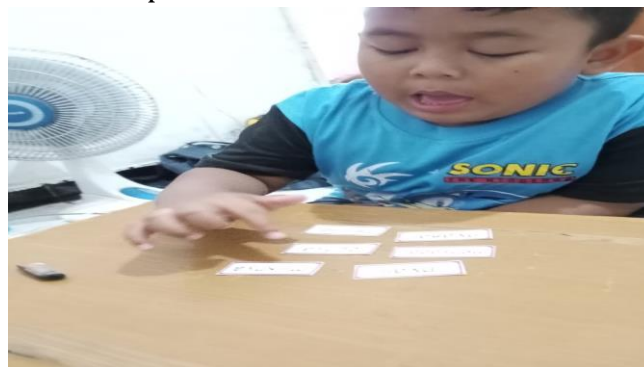
Gambar 2. Anak sedang menyebutkan kata yang ada di kartu kata AHE

Berdasarkan wawancara bu guru NA dan bu guru AU menunjukkan bahwa penggunaan metode Kartu Kata AHE dapat: a). mempercepat pengenalan huruf, b). meningkatkan kemampuan membaca permulaan, c). meningkatkan kosa kata anak, d). meningkatkan keberanian anak untuk membaca di depan teman, e). membantu anak yang mengalami kesulitan dalam fokus atau konsentrasi. Dapat dilihat dari hasil dokumentasi yang dilakukan penulis.