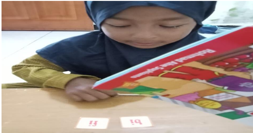
Gambar 3. Anak membaca kartu kata dengan bermain selayang pandang

ketika anak melihat gambar kucing, mereka mudah mengingat kata kucing dan huruf-huruf yang menyusunnya. Ini sesuai dengan teori Dual Coding yang menyatakan bahwa informasi visual dan verbal meningkatkan retensi memori [19]. Keempat, Mendorong Pembelajaran Mandiri. Kartu dapat dimainkan secara perorangan atau dalam kelompok. Anak memiliki kesempatan untuk mencocokkan kartu huruf dengan kartu gambar secara mandiri. Dapat dilihat dari gambar berikut ini.