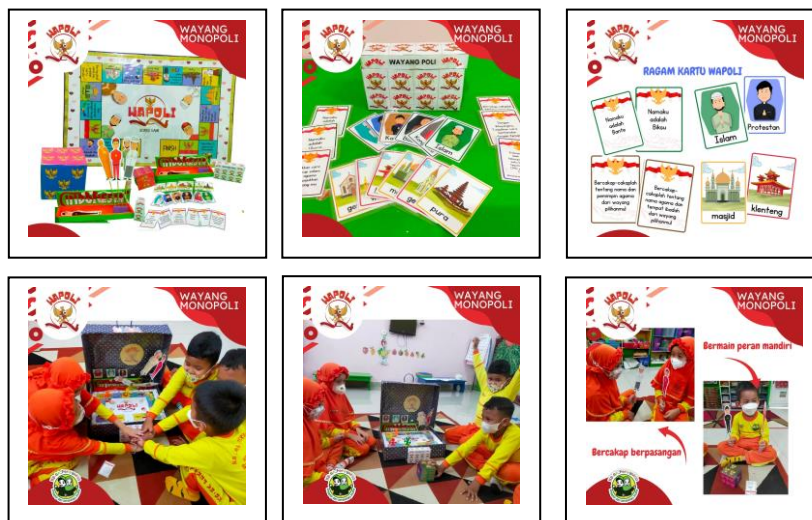
Gambar 3. Media dan proses Permainan dengan Wayang Monopoli

Berikut adalah gambar media permainan Wayang Monopoli serta proses anak saat bermain :