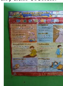
Gambar 3. Poster Doa

Temuan penelitian mengindikasikan bahwa guru menerapkan beberapa strategi dalam mengenalkan ibadah sholat kepada anak usia dini. Strategi pertama adalah penggunaan media visual, seperti miniatur sholat, alat peraga wudhu, buku panduan, dan poster. Media-media tersebut membantu anak memahami urutan gerakan dan bacaan sholat secara lebih konkret sehingga pembelajaran menjadi lebih menarik dan mudah dipahami. Temuan ini relevan dengan teori pembelajaran visual Agung yang mengatakan Media pembelajaran memiliki peran yang penting Dalam proses pembelajaran karena mempermudah anak dalam memahami materi serta mendukung pelaksanaan kegiatan belajar [20]. Susilowardani juga menyatakan Media gambar mempermudah guru dalam menyampaikan materi pembelajaran. Selain mudah diperoleh, media ini juga memiliki biaya yang ekonomis dan bisa dimanfaatkan di berbagai tempat. Penggunaan gambar dapat merubah konsep yang sebelumnya abstrak menjadi lebih nyata dan lebih mudah dimengerti. Oleh sebab itu, penggunaan media gambar dapat mendukung proses belajar siswa, membuat penyampaian informasi lebih jelas, terstruktur, dan tidak lagi bersifat abstrak [21]. Media gambar dapat dengan mudah diperoleh dari beragam sumber, seperti koran, majalah, brosur, maupun buku. Penggunaan media gambar oleh guru dapat dilakukan secara efektif dan efektif dalam menunjang proses pembelajaran karena media tersebut mampu membantu mendorong motivasi serta meningkatkan ketertarikan siswa terhadap materi pembelajaran [22].