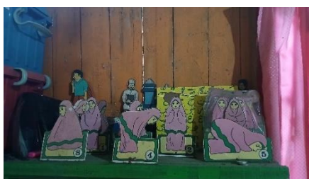
Gambar 2. Miniatur Sholat