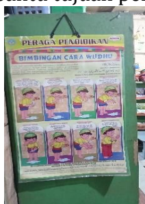
Gambar 1. Tata Cara Wudhu

luar sekolah belum terbentuk secara konsisten serta adanya pengaruh faktor psikologis, sosial, dan lingkungan digital. Salah satu faktor pendukung utama adalah pemberian pemahaman kepada anak tentang kegiatan sholat di sekolah serta dukungan orang tua dalam membantu persiapan dan penyediaan perlengkapan sholat. Adapun menurut [18], mengatakan bahwa Ada beberapa hal yang membantu guru mengajarkan shalat pada anak usia dini, misalnya dengan menyediakan fasilitas yang memadai seperti mikrofon, pengeras suara, dan kipas angin, alat sholat, poster, dan media tentang kebiasaan sholat. Menurut [19] mengatakan bahwa Faktor pendukung dalam pembelajaran, selain lingkungan, meliputi sarana dan prasarana pendidikan yang memiliki peranan penting dalam mendukung proses pembelajaran. Kedua aspek tersebut berfungsi untuk membantu tujuan pendidikan dapat tercapai dengan lancar, teratur, dan efektif.