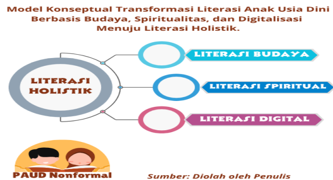
Gambar 3. Model Konseptual Transformasi Literasi Anak Usia Dini berbasis Budaya, Spiritual, dan Digitalisasi menuju Literasi Holistik

Komparasi dari kedua PAUD tersebut mengungkap bahwa sinergi: PAUD Istiqomah ( cultural-rooted ) dan PAUD Bismillah ( spiritual-structured ) menuju transformasi literasi holistik di Serang. Tabel 2 memperjelas perbedaan orientasi, fasilitas, dan dampak pada anak. Sintesis ini memperluas multiliteracies (Cope & Kalantzis), mengintegrasikan modalitas budaya-spiritual-digital dalam PAUD nonformal di Indonesia [18]. Model Literasi Holistik Anak Usia Dini menggambarkan siklus integratif: Budaya (akar identitas pengalaman lokal), Spiritual (landasan moral pembiasaan nilai), Digital (adaptasi teknologi media pendukung), berpusat pada Anak Holistik. Panah timbal balik menunjukkan umpan balik dinamis, berbasis new literacy studies . Model ini kontekstual untuk PAUD Merdeka Belajar yang menyeimbangkan tradisi dengan kesiapan digital.