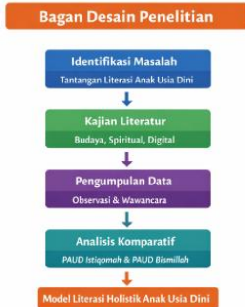
Gambar 2. Bagan Desain Penelitian

Keabsahan data dijaga melalui pendekatan trustworthiness Lincoln & Guba dengan empat kriteria utama [9]. Kredibilitas dicapai melalui triangulasi sumber (guru, kepala sekolah, orang tua), triangulasi metode (observasi, wawancara, dokumentasi), dan prolonged engagement selama 6 minggu di kedua PAUD.