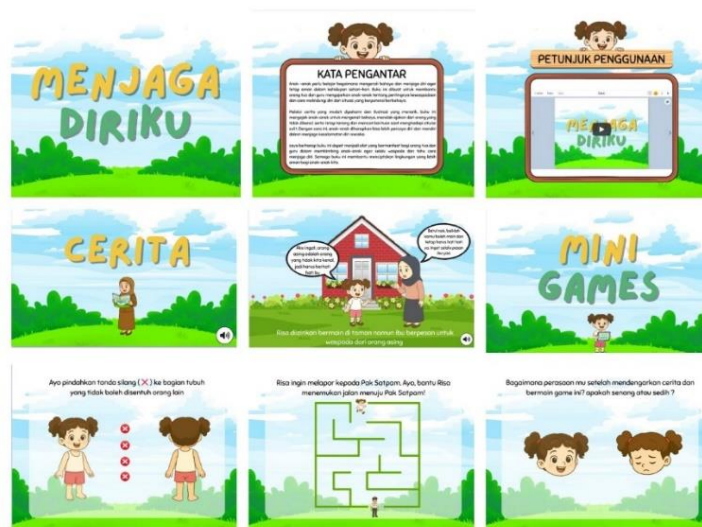
Gambar 1. Layout E-Book Interaktif

E-Book Interaktif mengintegrasikan unsur visual, audio, dan mini games dalam menyampaikan materi. Konten e-book berfokus pada langkah-langkah protektif yang dapat diambil anak ketika berhadapan dengan orang asing. Materi disajikan melalui narasi cerita anak yang diperkuat dengan elemen visual dan narasi audio yang direkam langsung oleh peneliti. Untuk meningkatkan keterlibatan anak dalam E-book ini, peneliti menyematkan mini games yang sesuai dengan materi yang diberikan, hal ini bertujuan untuk memperdalam pemahaman anak terhadap materi yang diberikan melalui cara yang menyenangkan. E-Book Interaktif ini mendapatkan nilai 94,45% dalam uji validasi keterbacaan media oleh ahli media dan mendapatkan nilai 98,75% dalam uji validasi media oleh ahli media selanjutnya mendapatkan nilai 100% dalam uji validasi keterbacaan media oleh ahli materi dan mendapatkan nilai 91,25% dalam uji validasi materi oleh ahli materi. Adapun tampilan E-Book Interaktif sebagai berikut :