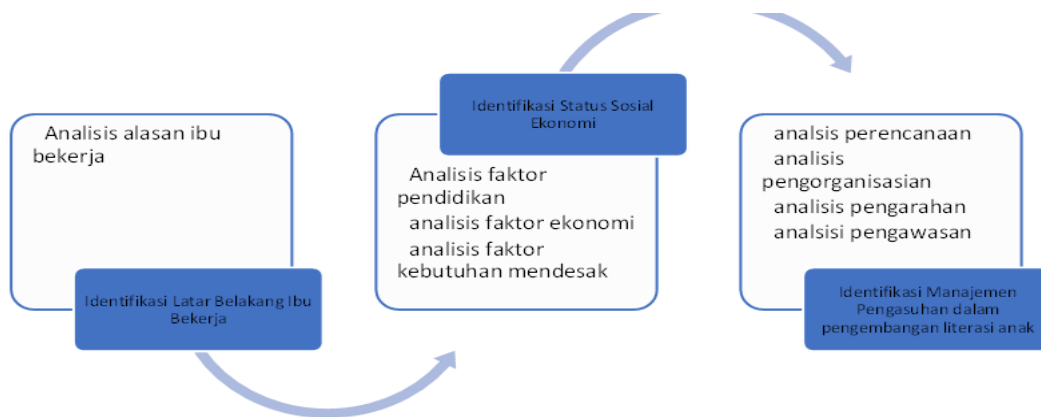
Gambar.1 Pendekatan dan Strategi Pemecahan Masalah

Lebih jauh, meskipun telah banyak studi yang mengkaji pengaruh status sosial ekonomi terhadap pengasuhan, masih terbatas penelitian yang menyoroti bagaimana ibu bekerja dengan segala keterbatasan waktu dan sumber daya mampu merancang dan menerapkan manajemen pengasuhan literasi yang efektif. Padahal, literasi usia dini tidak hanya menjadi fondasi akademis, tetapi juga penentu kesiapan anak memasuki tahap pendidikan selanjutnya. Dengan demikian, terdapat research gap yang perlu diisi, yaitu bagaimana sebenarnya mekanisme pengasuhan literasi yang dijalankan oleh ibu bekerja, serta bagaimana status sosial ekonomi memengaruhi variasi strategi tersebut.