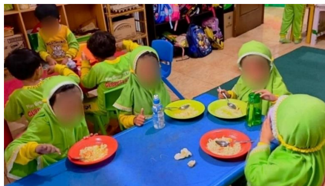
Gambar 2. Kegiatan Makan Bersama di Kelas

Ketiga, pelaksanaan program pemberian makanan bergizi di TK Islam Plus Qurrota A'yun 1 Malang menunjukkan implementasi manajemen yang sistematis, responsif, dan partisipatif. Tahapan pelaksanaan dimulai dengan persiapan harian berupa pengadaan bahan makanan segar, pengolahan yang higienis, hingga penyajian tepat waktu oleh guru kelas yang terlibat langsung dalam proses [30]. Praktik yang dilakukan menekankan pembiasaan nilai Islami, seperti mencuci tangan, berdoa, dan makan dengan tangan kanan. Strategi pelaksanaan ini juga memperlihatkan keberhasilan optimalisasi sumber daya internal ( man ) dan metode kerja ( method ) dalam lingkungan PAUD yang memiliki keterbatasan fasilitas [21]. Kegiatan makan bersama tidak hanya menjadi sarana distribusi makanan, tetapi juga media pendidikan karakter, pembentukan kemandirian, dan internalisasi nilai tanggung jawab pada anak usia dini [31].