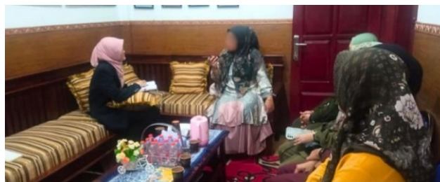
Gambar 3. Kegiatan Wawancara dengan Wali Murid

Temuan ini turut diperkuat oleh wawancara bersama wali murid yang mengungkap adanya perubahan signifikan pada kebiasaan makan anak di rumah, baik dari segi keteraturan, sikap selama makan, hingga antusiasme terhadap menu baru. Anak mulai menunjukkan inisiatif untuk makan tanpa diingatkan, menjalankan rutinitas seperti mencuci tangan, duduk tenang, berdoa, serta menegaskan pentingnya kehadiran sayur sebagai bagian dari menu harian. Kebiasaan positif yang dibentuk di sekolah terbukti terbawa ke rumah tanpa harus diulang oleh orang tua, menunjukkan bahwa pengaruh program meluas hingga pada pola pengasuhan keluarga, termasuk cara orang tua mengorientasikan pilihan menu dan membangun suasana makan yang lebih kondusif.