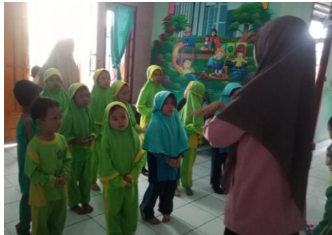
Gambar 1. Latihan Paduan Suara

Pada pembelajaran Projek PAUD Ummusshabri Unaaha dan Wawotobi pada kegiatan paduan suara Anak didik dilakukan oleh Kelas A. kelompok paduan Suara terbagi menjadi dua kelompok yaitu kelompok satu dengan menyanyikan lagu Indonesia Raya dan Lagu Garuda Pancasila dan kelompok 2 dengan menyanyikan lagu Asmaul Husna dan lagu berbahas Inggris dengan judul when I was . Sebelum tiap kelompok menyajikan penampilan paduan suara, anak didik dibantu oleh guru dilatih dalam melafalkan dan melagukan lagu dengan beberapa judul diatas. Latihan paduan suara dilakukan pada tahap pra pengembangan sekitar 2 minggu sebelum penampilan paduan suara dilakukan. Berikut ini adalah gambar penampilan paduan suara anak PAUD Ummushabri Konawe: