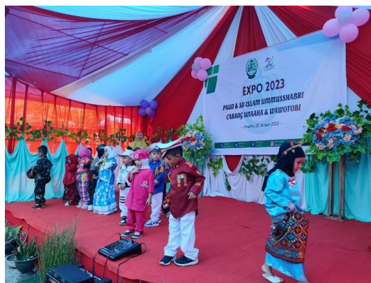
Gambar 2. Fashion Show

Montolalu Menjelaskan bahwa Langkah-langkah kegiatan fashion show begitu banyak mengakomodir perkembangan potensi anak antara lain perkembangan fisik motoric ketika berjalan di atas panggung. Anak berjalan di atas panggung memerlukan kegiatan fisik. Melalui kegiatan fashion show anak dapat membentuk kesan tentang dirinya maupun dengan lingkungannya [13].