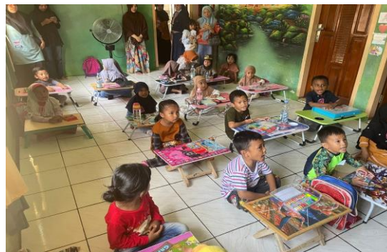
Gambar 3. Mewarnai

Pada PAUD Ummusshabri di Kabupaten Konawe, sebelum kegiatan mewarnai dimulai para anak didik mempersiapkan alat dan bahan yang akan digunakan dalam kegiatan mewarnai yaitu mempersiapkan meja kecil sebagai tempat anak mewarnai, mempersiapkan pensil warna dan gambar yang ingin diwarnai. Kegiatan mewarnai merupakan kegiatan anak membubuhkan warna ke gambar polos yang telah disediakan oleh guru. Gambar polos tersebut kemudian diwarnai dengan krayon warna sesuai dengan imajinasi anak PAUD Ummusshabri. Gambar polos yang disediakan merupakan gambar lingkungan sekolah yang terdiri dari gambar anak, bendera, gedung sekolah, pohon, matahari, bunga, awan dan lain lain. Berikut adalah gambar anak PAUD Ummusshabri mewarnai gambar.