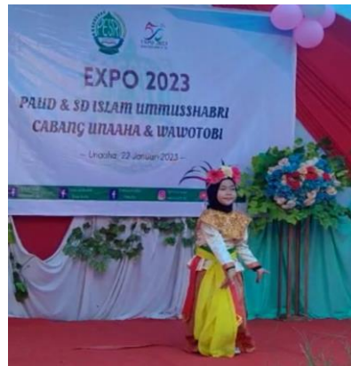
Gambar 4. Menari

Tahap penilaian dalam pembelajaran berbasis proyek adalah aspek yang tidak terpisahkan dengan pemberian pengalaman belajar. Penilaian suatu kegiatan dapat didefinisikan sebagai suatu aktifitas untuk menilai kemajuan individu dalam mencapai tujuan dan harapan tertentu [17]. Penilaian pembelajaran merupakan suatu kegiatan dalam hal mengumpulkan informasi secara sistematis, komprehensif dan sustainable guna mendapatkan pencapaian hasil kegiatan yang dilakukan oleh anak [18].