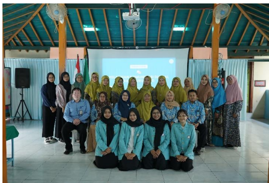
Gambar 2. Peserta dan Tim Pengabdian

Namun, di lapangan masih ditemukan tantangan dalam penerapan komunikasi digital di lingkungan PAUD. Salah satu kendala utama yang dihadapi adalah keterbatasan keterampilan guru dalam menggunakan teknologi digital secara efektif [11]. Sebagai contoh, di TK Aisyiyah Bustanul Athfal Joyosuran Kota Surakarta, banyak pendidik yang belum memiliki kompetensi yang memadai dalam komunikasi digital. Keterbatasan ini dapat berdampak pada kurang optimalnya hubungan antara guru dan orang tua, yang berisiko menimbulkan beberapa permasalahan berikut: 1) Sebagian besar guru belum memiliki pemahaman yang memadai tentang cara berkomunikasi secara efektif melalui platform digital. 2) Masih terdapat kesenjangan dalam penggunaan media digital untuk membangun keterlibatan orang tua dalam pendidikan anak. 3) Beberapa guru merasa kesulitan dan kurang percaya diri dalam mengadopsi teknologi baru dalam komunikasi. 4) Guru memiliki jadwal yang padat, sehingga memerlukan strategi yang tepat agar pelatihan tidak mengganggu tugas utama mereka dalam mendidik anak.