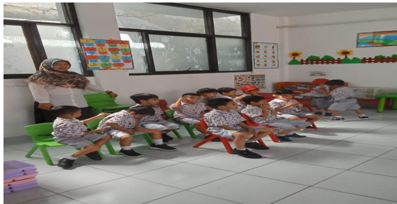
Gambar 4. Anak PAUD disuruh duduk rapi dan tenang

Pada gambar terlihat guru sedang berperan sebagai fasilitator, narasumber, dan manajer kelas yang demokratis Pembelajaran interaktif menciptakan suasana belajar yang lebih menyenangkan dan tidak membosankan. Duduk rapi dan tenang, terutama saat belajar atau di majelis ilmu, termasuk dalam akhlak yang baik. Hal tersebut, bagian dari adab terhadap guru atau orang yang lebih tua, serta menciptakan suasana yang kondusif untuk belajar dan menerima ilmu.