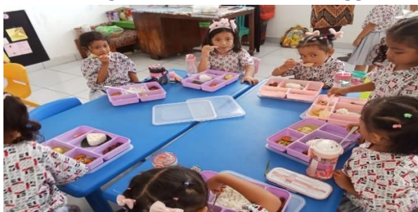
Gambar 2. Anak menggunakan tangan kanan ketika makan

Berperilaku dapat dilihat juga ketika anak makan dengan menggunakan tangan kanan, menggunakan tangan kanan saat makan adalah adab yang diajarkan dalam Islam dan merupakan bagian dari akhlak yang baik. Rasulullah SAW menganjurkan umatnya untuk makan dan minum dengan tangan kanan karena tangan kanan dianggap lebih bersih dan mulia, serta mengikuti sunnah Rasulullah yang juga makan dan minum dengan tangan kanan. Berikut ini gambar anak makan menggunakan tangan kanan.