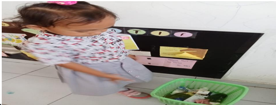
Gambar 3. Anak membuang sampah di keranjang sampah

menolong dan menghargai. Selain itu, penggunaan metode keteladanan, pembiasaan, nasihat, dan hukuman juga dapat diterapkan, sesuai dengan konteks dan kebutuhan anak. Pembentukan akhlak dilakukan sejak dini. Ibu A salah satu guru yang diwawancarai juga menyampaikan selalu mengajarkan hal-hal baik di sekolah seperti tidak membuang sampah sembarangan termasuk akhlak terhadap lingkungan. Akhlak anak dalam membuang sampah pada tempatnya adalah bagian dari pendidikan karakter yang penting untuk membentuk kesadaran akan kebersihan lingkungan dan tanggung jawab sosial. Membiasakan anak membuang sampah pada tempatnya sejak dini akan menumbuhkan kebiasaan baik yang berkelanjutan hingga dewasa. Berikut ini gambar anak membuang sampah pada tempatnya.