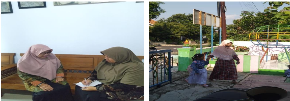
Gambar 2. Wawancara dan Mengantar anak ke sekolah

atau hindari membawa beban kerja ke rumah. Berikut adalah dokumentasi dari penelitian yang dilakukan di TK TUGU 01 Jumantono.