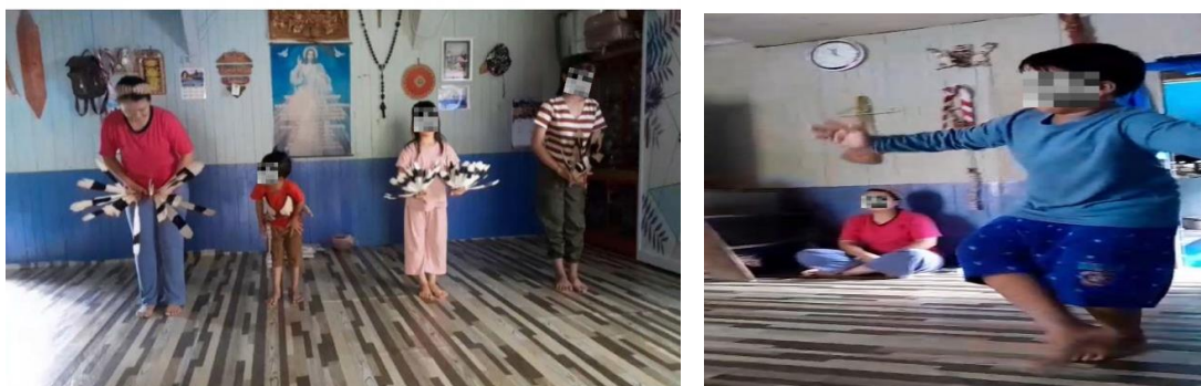
Gambar 1. Kegiatan latihan Tari Enggang di rumah bersama orang tua

Dengan demikian, pola asuh orang tua di Desa Mamahak Besar dalam konteks pembelajaran Tari Enggang dapat disimpulkan sebagai pola yang kolaboratif, berbasis nilai budaya, dan mendukung pembentukan identitas budaya anak secara kuat. Dalam hal ini, orang tua tidak memaksakan kehendak, namun justru memberikan penjelasan mengenai makna Tari Enggang dan pentingnya melestarikan budaya Dayak Bahau.