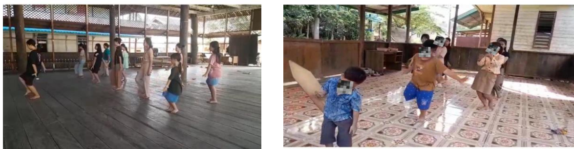
Gambar 2. Kegiatan berlatih tari enggang di lamin adat dan sanggar seni desa Mamahak Besar

Penelitian oleh [27] juga mendukung temuan ini, di mana pola asuh demokratis terbukti dapat meningkatkan motivasi anak dalam mengikuti kegiatan seni budaya, karena anak merasa dihargai dan dilibatkan dalam setiap proses belajar. Nilai-nilai ini diajarkan melalui cerita-cerita lisan dan makna gerak tari, yang membuat proses pembelajaran menjadi lebih dalam dan bermakna bagi anak-anak. Dengan demikian, dapat disimpulkan bahwa pola asuh orang tua dalam pembelajaran Tari Enggang di Desa Mamahak Besar bersifat mendukung, terbuka, dan berakar pada kearifan lokal, sehingga tidak hanya mentransfer keterampilan seni, tetapi juga membentuk karakter dan identitas budaya anak Dayak Bahau. Dan ditemukan bahwa Tari Enggang memiliki peranan penting dalam pembentukan karakter anak-anak, khususnya dalam hal penanaman nilai budaya, kedisiplinan, rasa hormat, serta tanggung jawab.