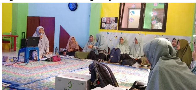
Gambar 2. Pertemuan rutin kegiatan Komunitas Belajar

Dengan melakukan sintesis terhadap data yang diperoleh, dapat disimpulkan bahwa komunitas belajar di TK IT BUAH HATI KITA Jember dapat menjadi wadah yang efektif untuk meningkatkan kualitas kompetensi pedagogik guru, berikut praktik baik pada kegiatan komunitas belajar yang telah dilaksanakan: pertama, Pertemuan rutin setiap pekan. Berdasarkan hasil observasi pada saat kegiatan komunitas belajar. Pada setiap pekan guru dan tenaga kependidikan membiasakan mengadakan pertemuan rutin untuk mendiskusikan isu-isu kegiatan pembelajaran, berbagi pengalaman, dan mencari solusi bersama. Pada saat observasi terdapat guru dan tenaga kependidikan melaksanakan refleksi kegiatan pembelajaran, terdapat guru yang memiliki sebuah kesulitan dalam menangani siswa saat kegiatan pembelajaran. Guru tersebut menceritakan permasalahan yang telah dialaminya pada hari itu, kemudian guru tersebut berkata “Menurut ibu-ibu saya harus bagaimana ya? Apakah ibu-ibu disini pernah mengalami hal yang sama seperti saya?”. Pada saat itu pula terdapat guru lain yang memberikan pendapat serta ada guru yang pernah mengalami hal yang sama sehingga berbagi pengalaman saat menangani permasalahan tersebut.