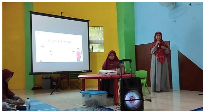
Gambar 4. Praktik baik guru dalam mengembangkan kurikulum

Keenam, Mentoring dan Coaching. Pada kegiatan komunitas belajar di TK IT BUAH HATI KITA Jember berdasarkan hasil dokumentasi, kegiatan tersebut menyediakan program mentoring dan coaching bagi guru-guru yang memerlukan bantuan dalam menerapkan kegiatan pembelajaran di kelas yang efektif. Berdasarkan hasil wawancara mentoring yang telah dilaksanakan adalah mentoring guru kepada guru yang lain salah satunya dalam mengembangkan keterampilan mengajar dan mengelola kelas. Sedang coaching yang dilaksanakan adalah coaching pengembangan kurikulum, seorang guru yang menjadi coach yang dapat membantu guru dalam mengembangkan kurikulum yang efektif dan meningkatkan kualitas pembelajaran.