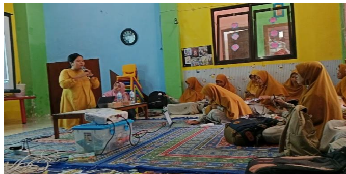
Gambar 2. Workshop pada Komunitas Belajar

Keempat, Workshop dan Pelatihan. Kegiatan workshop dan pelatihan yang dilakukan pada komunitas belajar berfokus pada pengembangan kompetensi guru dalam menerapkan kegiatan pembelajaran di kelas. Topik yang dibahas diantaranya strategi pembelajaran aktif, pengembangan media pembelajaran, penilaian autentik, serta topik untuk memenuhi kebutuhan perkembangan anak sesuai apa yang dibutuhkan. Berdasarkan hasil observasi yang dilakukan oleh peneliti terdapat beberapa kegiatan yang dilaksanakan pada komunitas belajar di TK IT BUAH HATI KITA Jember. Diantaranya workshop yang berjudul “Deteksi Dini & Intervensi Anak Autisme”.