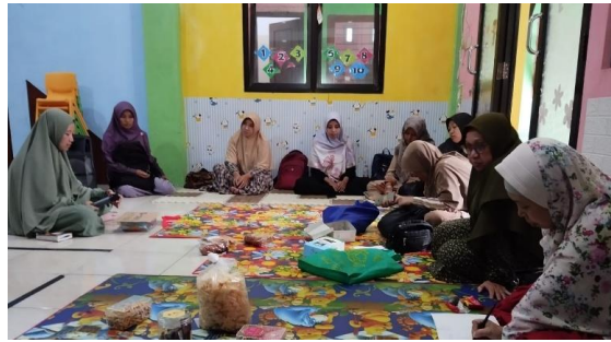
Gambar 3. Praktik baik guru dalam pengembangan media

Keenam, Mentoring dan Coaching. Pada kegiatan komunitas belajar di TK IT BUAH HATI KITA Jember berdasarkan hasil dokumentasi, kegiatan tersebut menyediakan program mentoring dan coaching bagi guru-guru yang memerlukan bantuan dalam menerapkan kegiatan pembelajaran di kelas yang efektif. Berdasarkan hasil wawancara mentoring yang telah dilaksanakan adalah mentoring guru kepada guru yang lain salah satunya dalam mengembangkan keterampilan mengajar dan mengelola kelas. Sedang coaching yang dilaksanakan adalah coaching pengembangan kurikulum, seorang guru yang menjadi coach yang dapat membantu guru dalam mengembangkan kurikulum yang efektif dan meningkatkan kualitas pembelajaran.