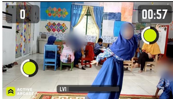
Gambar 4. Anak-anak mengikuti instruksi gerakan dalam aplikasi D_Active Arcade

Secara keseluruhan, hasil ini memberikan bukti empirik bahwa penggunaan aplikasi digital berbasis gerak memiliki potensi besar dalam mendukung perkembangan motorik kasar anak usia dini. Keunggulan yang ditunjukkan oleh kelompok eksperimen menunjukkan bahwa integrasi teknologi dalam kegiatan fisik anak bukan hanya inovatif, tetapi juga berdampak nyata dan signifikan. Temuan ini memperkuat urgensi pemanfaatan media pembelajaran yang relevan dengan karakteristik anak di era digital sebagai bagian dari strategi pendidikan yang efektif.