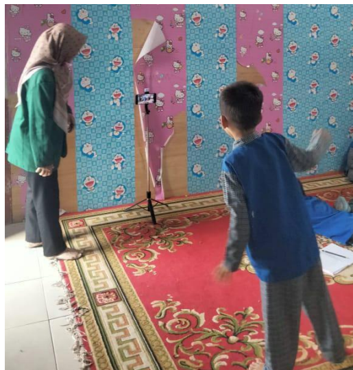
Gambar 3. intervensi kegiatan motorik kasar menggunakan aplikasi D_Active Arcade .

Untuk mendukung hasil tersebut, berikut adalah dokumentasi kegiatan intervensi motorik kasar menggunakan aplikasi D_Active Arcade pada kelompok eksperimen di TK Widya Bhakti.