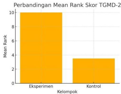
Gambar 2. Grafik perbandingan mean rank skor TGMD-2 antara kelompok eksperimen dan kontrol.

motorik kasar setelah perlakuan. Dengan demikian, hipotesis nol ( H_0 ) yang menyatakan tidak ada perbedaan antara kedua kelompok ditolak, dan hipotesis alternatif ( H_1 ) diterima.