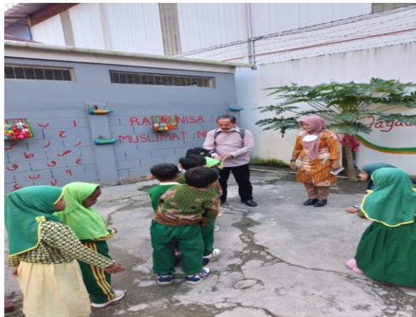
Gambar 2. Perkembangan social anak dengan pengasuhan demokratis

Melalui pengambilan data yang ada peneliti menemukan bahwa perkembangan sosial emosional anak yang memiliki orang tua tunggal yang ada di RA An-Nur Kota kendari dari tiga anak (peserta didik) yang orang tua tunggal yang ada, memiliki kecenderungan yang hampir sama yaitu dari tiga indikator perkembangan social emosional yang ada yaitu kesadaran diri, tanggung jawab terhadap diri sendiri dan orang lain serta perilaku prososial kurang dimiliki oleh peserta didik. Berdasarkan hasil observasi yang dilakukan oleh peneliti di RA An-Nur Kota Kendari menunjukkan bahwa perkembangan sosial emosional anak dengan pengasuhan demokratis yaitu anak sangat antusias untuk bersalaman dengan kepala sekolah dan tamu dari kepala sekolah yang datang berkunjung. Anak yang memiliki orang tua tunggal kurang menunjukkan sikap yang antusias dalam bersosialisasi.