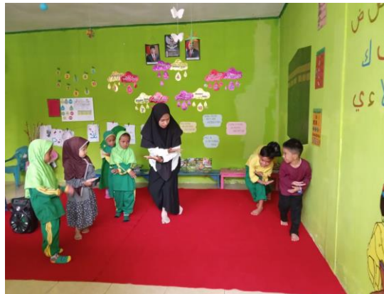
Gambar 5. Kegiatan menari "Ma"

temannya. Anak dengan pengasuhan orang tua tunggal sangat kurang berinteraksi dan bergaul dengan teman sebayanya dalam kegiatan yang menyenangkan bagi anak-anak yang mengikuti pendidikan prasekolah.