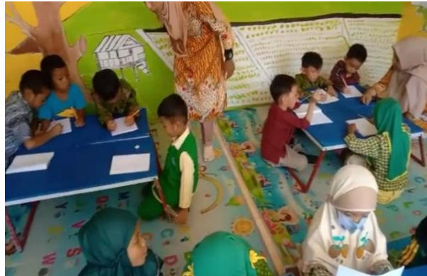
Gambar 8. Ma Punya Kemauan untuk Melakukan Sesuatu Sesuai dengan Arahan Guru

bersama dengan teman-temannya yang lain; kesadaran diri, tanggung jawab terhadap diri sendiri dan orang lain serta perilaku prososial ada pada rentang penilaian yang dominan yaitu berkembang sesuai harapan.” (Asni, S.Pd, Guru RA An-Nur Baruga kendari).