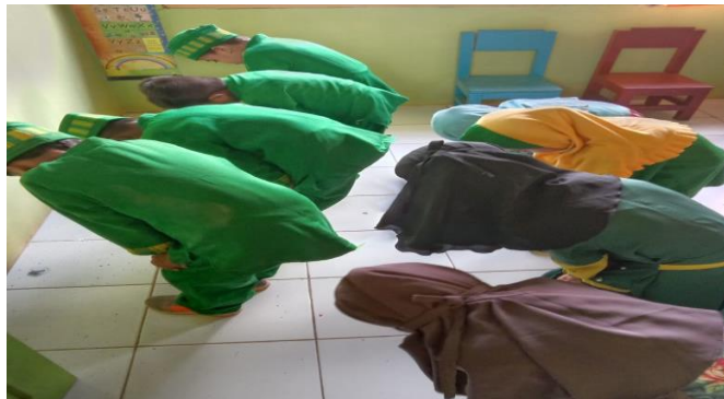
Gambar 4. Aktivitas “Ma”

Hasil observasi yang dilakukan oleh peneliti di RA An-Nur di Kota Kendari tentang aktivitas “Ma” saat pembelajaran yaitu kegiatan praktek sholat yang dilakukan bersama-sama temannya dengan arahan guru. “Ma” bersama peserta didik (anak) yang lain mengikuti arahan guru namun “Ma” lebih memilih untuk berada di posisi paling ujung di antara teman-temannya yang lain. Temuan penelitian ini juga didukung oleh hasil temuan melalui wawancara peneliti dengan guru kelompok A di RA An-Nur Kota Kendari yang menyatakan bahwa “Ma” kurang suka berada di posisi tengah di antara teman-temannya baik saat belajar seperti biasa maupun kegiatan-kegiatan lainnya: “Ma kurang atau tidak mau berada di posisi tengah namun memiliki sikap social yang cukup baik, dia tetap mengikuti semua arahan dan aktivitas secara antusias hanya jika dilihat dari kategori penilaian yang ada untuk social emosionalnya berapa pada kategori mulai berkembang dan beberapa dari indikator perkembangan yang ada berapa pada kategori berkembang sesuai harapan” (Asni, S.Pd, Guru RA An-Nur Baruga kendari).