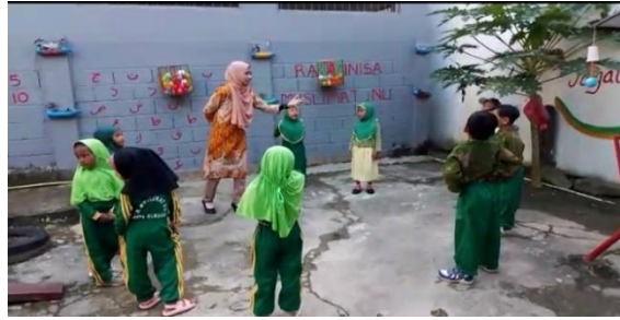
Gambar 7. Pengasuhan Orang Tua Tunggal Cukup Disiplin

Kedua, Gaya Pengasuhan Orang Tua Tunggal dengan Pola Otoriter Membentuk Sosial Emosional Anak. Gaya pengasuhan orang tua kepada anak (peserta didik) dilakukan sesuai dengan falsafah hidup, pendidikan, pengalaman dan harapan serta tuntutan orang tua kepada anak-anaknya. pengasuhan orang tua (tunggal) pada “Ma” dilakukan secara otoriter membentuk perkembangan social emosional terlibat dalam kegiatan pembelajaran di sekolah karena ada arahan dan tuntutan dari guru sehingga anak cenderung untuk taat sesuai dengan permintaan guru. hal ini disadari sebagai bentuk keterpaksaan dan kebiasaan anak untuk melakukan sesuatu sesuai dengan permintaan orang tua (tunggal) di rumah.