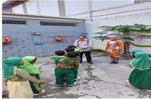
Gambar 6. Pengasuhan Orang Tua Tunggal

Anak dengan pengasuhan orang tua tunggal tidak menunjukkan atau berusaha sebaik-baiknya dari temannya untuk menambah sosialisasi. Takut, muncul ketika anak berada pada situasi yang kurang menyenangkan. Lestari menyatakan bahwa pola asuh sangat mempengaruhi perkembangan perilaku anak terutama pada sisi kemandirian anak tersebut [15]. Ayun mengemukakan bahwa kepribadian anak akan dipengaruhi oleh beberapa faktor yang sering bersentuhan langsung dengan anak, bahkan untuk kepribadian yang jangka panjang akan dipengaruhi oleh pola asuh orang tua [16]. Sehingga dapat dipahami bahwa segala aktivitas anak dipengaruhi oleh perlakuan orang-orang terdekatnya (pola asuh) terutama orang tuanya.