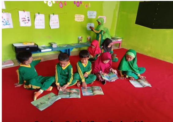
Gambar 3. Aktifitas Fa dan Nf

selanjutnya pada perkembangan social emosional “Ma” dapat dilihat pada dokumen observasi yang ada di bawah ini yaitu: